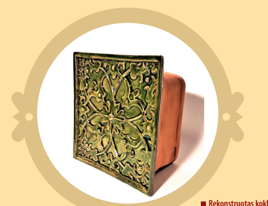
Rekonstruotas koklis iš Malūnų gatvės Vilniuje.