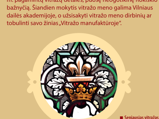
Seniausias vitražas iš Rokiškio bažnyčios.

Vaikščiodami Senamiesčiu vitražų surasite nesunkiai. Pasidomėjus jų istorijomis – languose atgims įvairūs istoriniai įvykiai ir asmenybės, legendos ir simboliai. Nuostabūs vitražai jus pasitiks Nacionalinėje ir Vrublevskių bibliotekose, Vilniaus centriniame knygyne, daugumoje sostinės šventovių. Užsukus į „Vitražo manufaktūrą“ Stiklių gatvėje pamatytumėte įspūdingų kūrinių, stebinančių savo įvairove, stiklo formomis ir kūrėjų fantazija. O gotikiniuose XVI a. rūsiuose rastumėte pirmąjį vitražo muziejų Lietuvoje. Seniausias muziejaus eksponatas – Vienos dirbtuvėse 1882 m. pagamintų vitražų detalės, puošę neogotikinę Rokiškio bažnyčią. Šiandien mokytis vitražo meno galima Vilniaus dailės akademijoje, o užsakyti vitražo meno dirbinių ar tobulinti savo žinias „Vitražo manufaktūroje“.