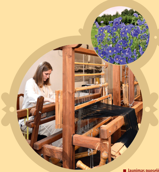
Jau nimas puoselėja tradiciją (audimas).

Vilniuje audimo dirbtuvėje „Jūrėtės manufaktūra“ dar galima susipažinti su „lino keliu“ ir pausti autentiškomis staklėmis. Šioje dirbtuvėje lankėsi žurnalistas net iš Japonijos, Prancūzijos, Vokietijos, aprašė sumaniai gaivinamą Lietuvos audėjų paveldą ir šiuolaikinę kūrybą. Dirbtuvė daug dėmesio skiria jaunomenės ugdymui. Čia žinias tobulina šalies studentai ir pavieniai Vilniaus svečiai.