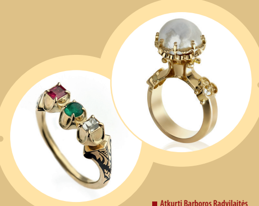
Atkurta Barbaros Radvilaitės ir Vytauto Didžiojo žiedai.

Puikias Vytauto Didžiojo ir Barbaros Radvilaitės žiedų replikas padarė Vilniaus juvelyras, Dominikonų g. įkūręs juvelyrikos galeriją-mokyklą „Vilnensis“. Nors šio amato meistrai tradiciškai būdavo vyrai, šiuo laiku daugiausiai jo mokosi merginos ir moterys. Puikiai šiuolaikine juvelyrika pasigrožėti galima ir Basanavičiaus g. esančioje galerijoje „Meno niša“.