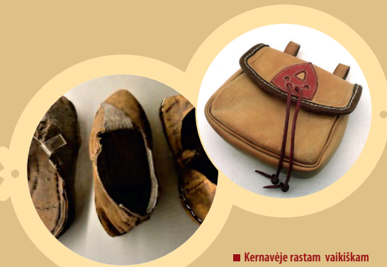
Kernavėje rastam vaikų batukui (centre) – 900 metų.

Apsilankykite Savičiaus g. esančioje Senujų amatų dirbtuvėje susipažinti su odadirbiais. Čia išvysite senuosius apavus, krepšius, diržus ir kitus odinius gaminius. Edukacinių programų dalyviai gali patys pabandyti odą kirsti, siūti, kniedyti ar dekoruoti, o gal net pavyks pasisiūti kapšą ar senovinį apavą.