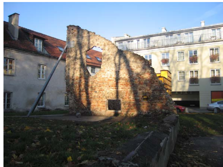
Ūkinio pastato liekanos