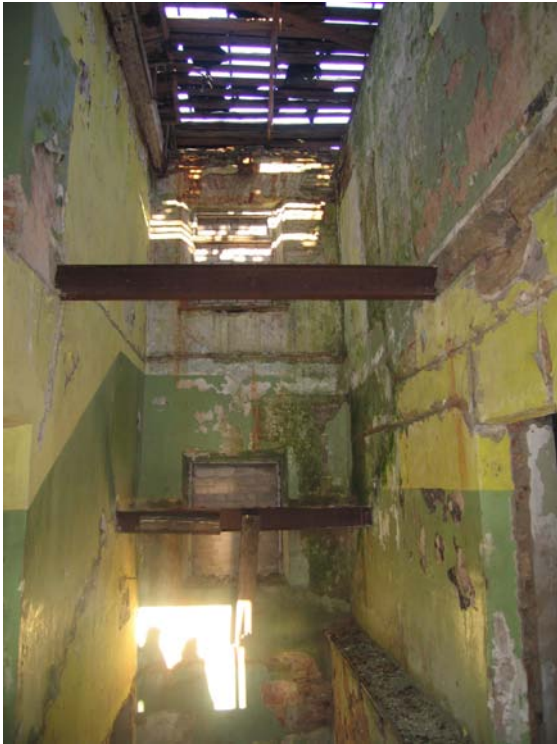
Vaizdas pastato viduje