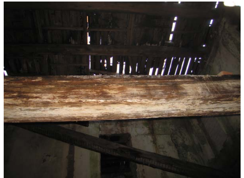
Vaizdas pastato viduje