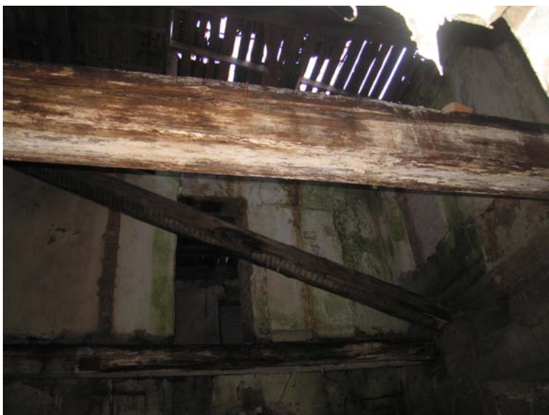
Vaizdas pastato viduje