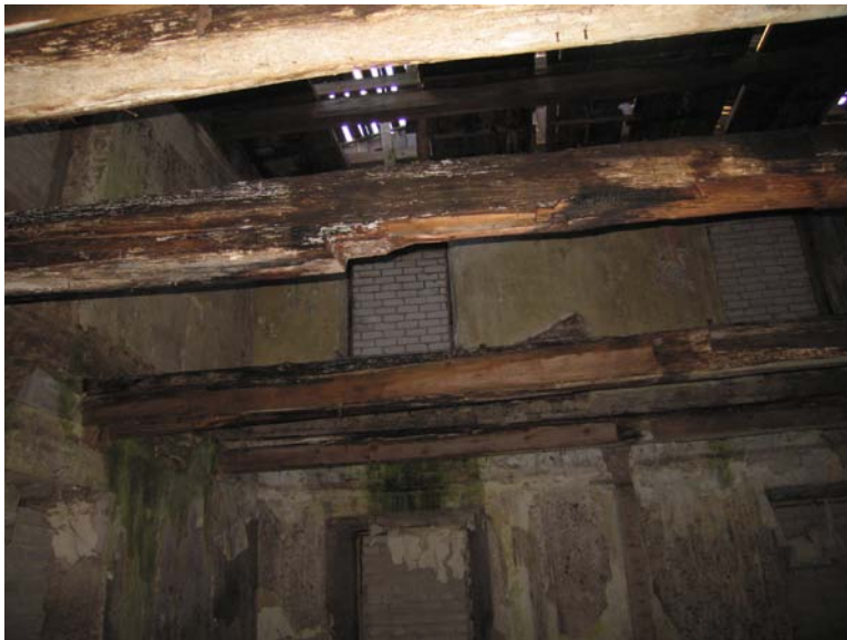
Vaizdas pastato viduje