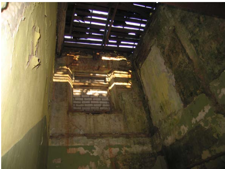
Vaizdas pastato viduje