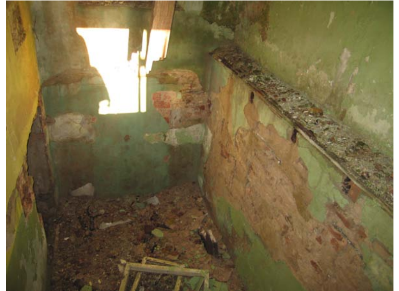
Vaizdas pastato viduje