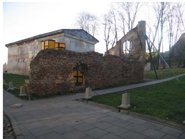
Ūkinio pastato liekanos