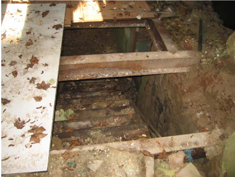
Vaizdas pastato viduje