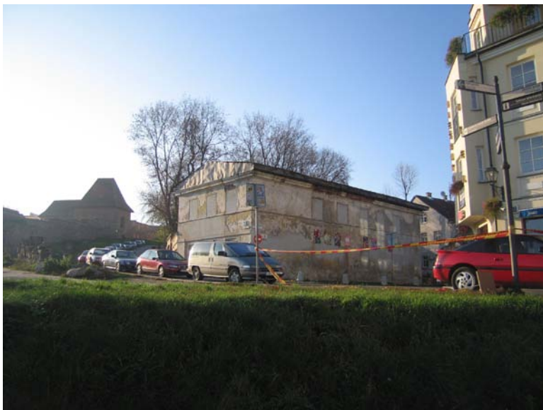
Pastato vaizdas nuo Kūdrų g. pusės