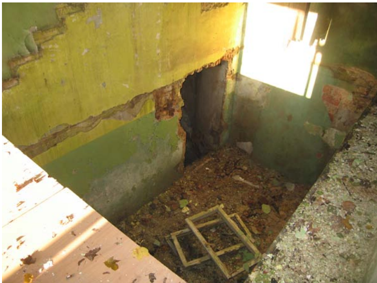
Vaizdas pastato viduje