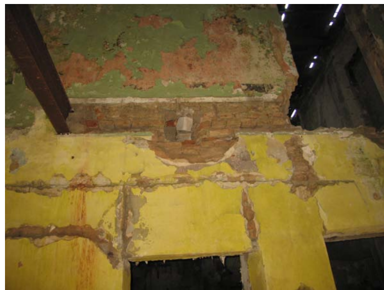
Vaizdas pastato viduje