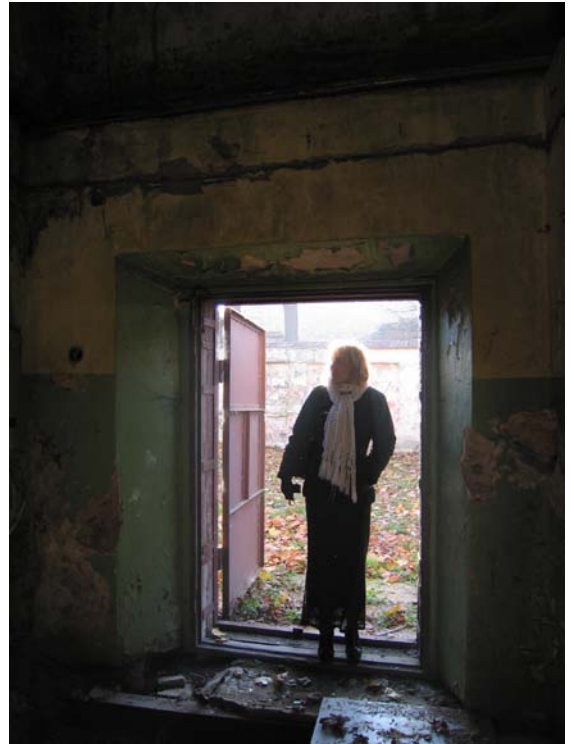
Vaizdas pastato viduje