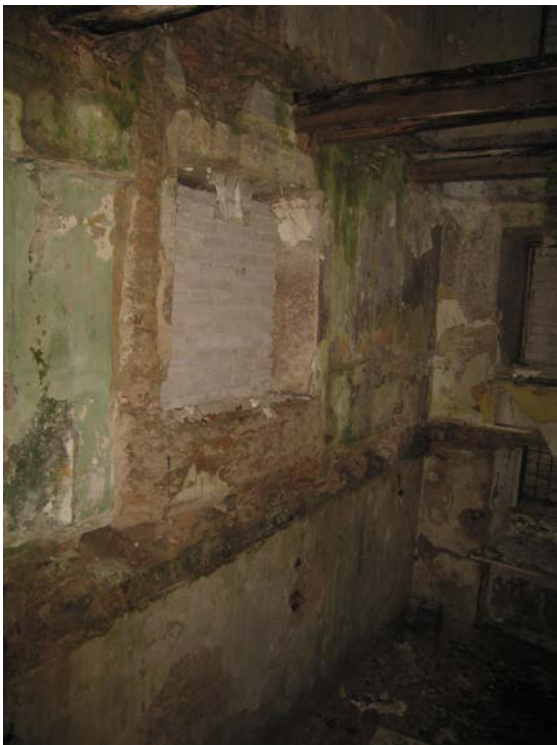
Vaizdas pastato viduje