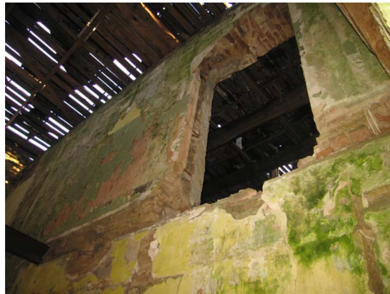
Vaizdas pastato viduje