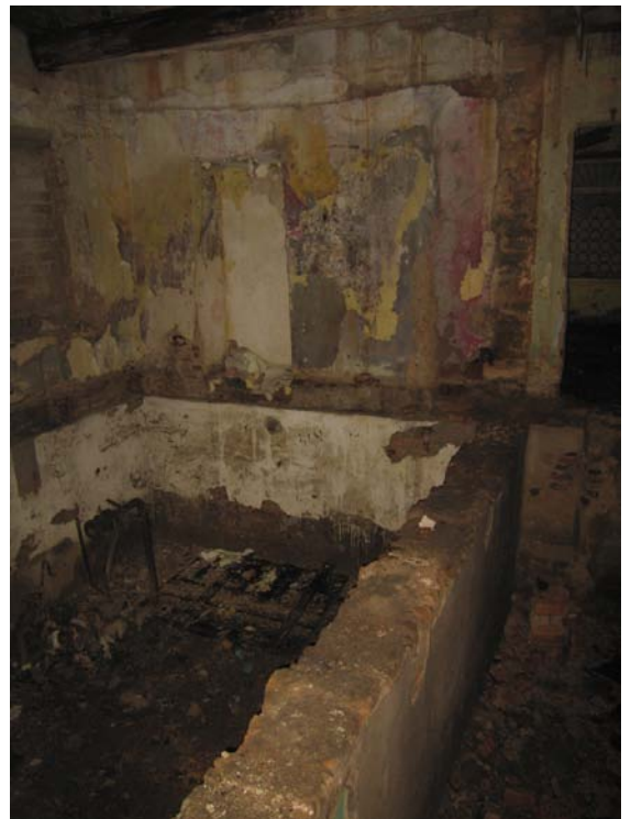
Vaizdas pastato viduje