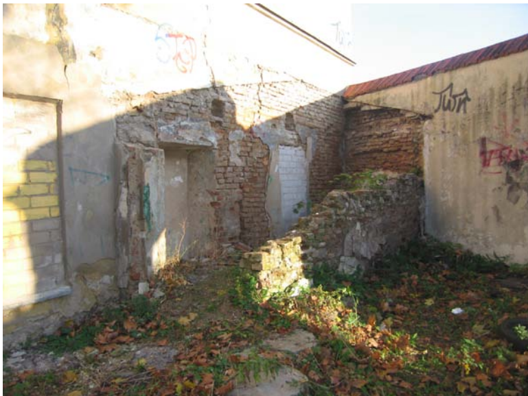
Pastato pietinio fasado ir tvoros fragmentai