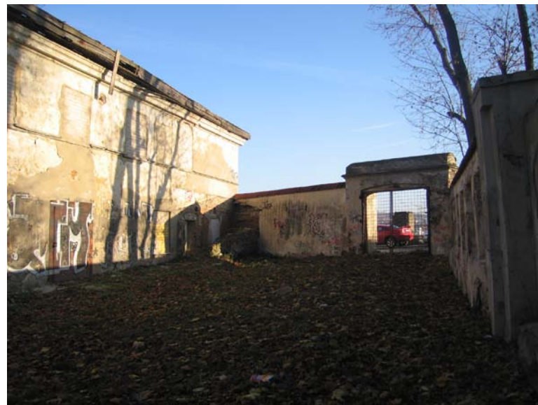
Pastato pietinio fasado fragmentas ir vartai į Bokšto g.