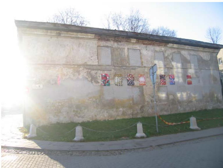
Pastato šiaurinis Šv. Kazimiero g. fasadas