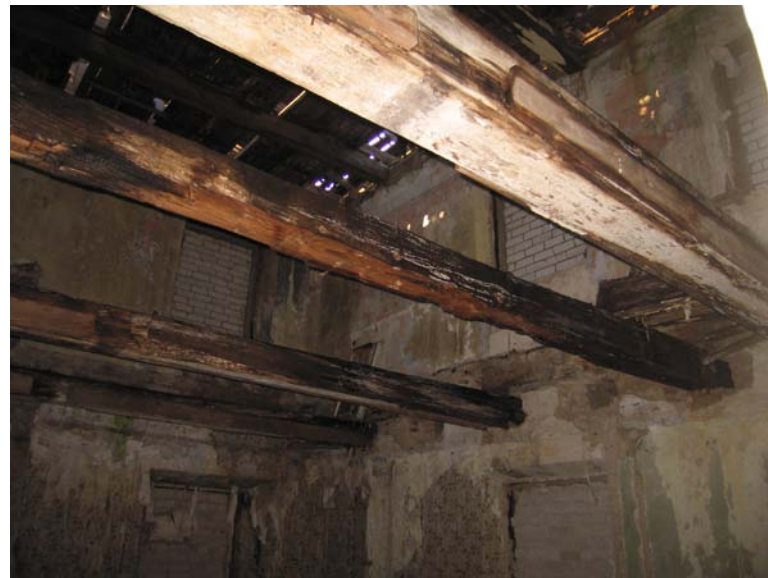
Vaizdas pastato viduje