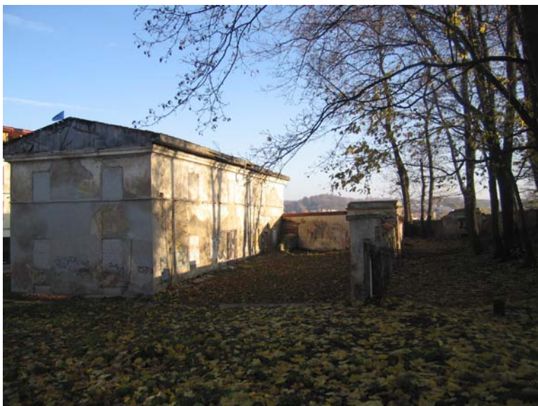
Pastato vakarinis ir pietinis fasadai ir tvora dalinanti sklypą