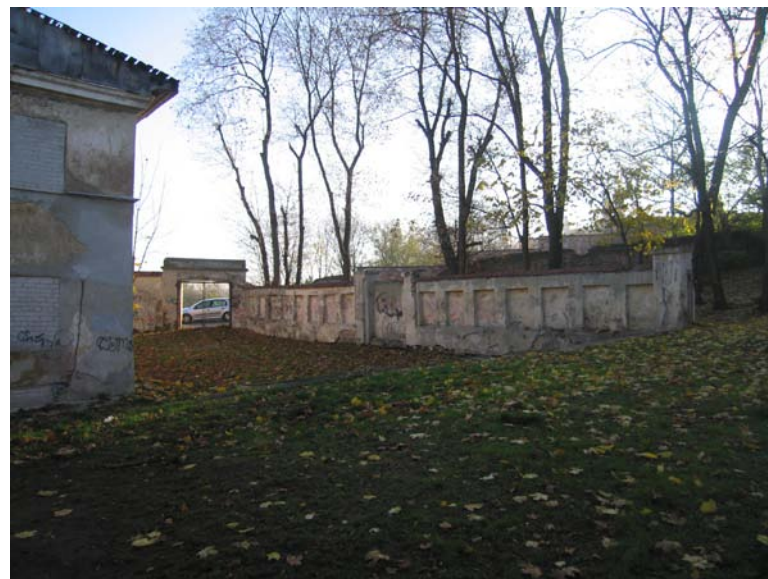
Pastato vakarinio fasado fragmentas, tvora dalinanti sklypą ir vartai į Bokšto g.