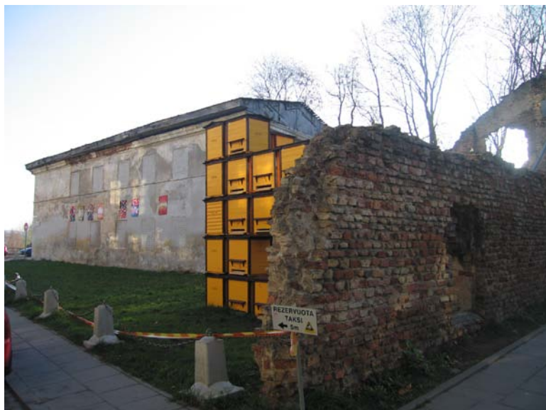
Pastato šiaurinis fasadas ir ūkinio pastato liekanos