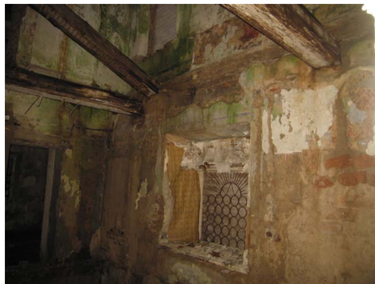
Vaizdas pastato viduje