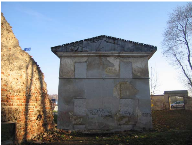
Pastato vakarinis fasadas