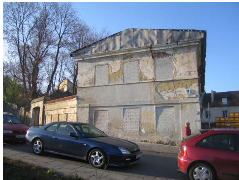
Pastato rytinis Bokšto g. fasadas