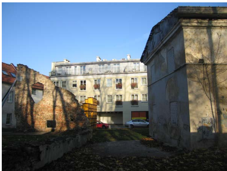
Ūkinio pastato liekanos ir pastato vakarinis fasadas