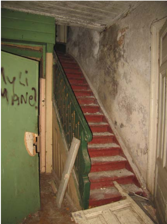
Laiptai patalpoje 1-1