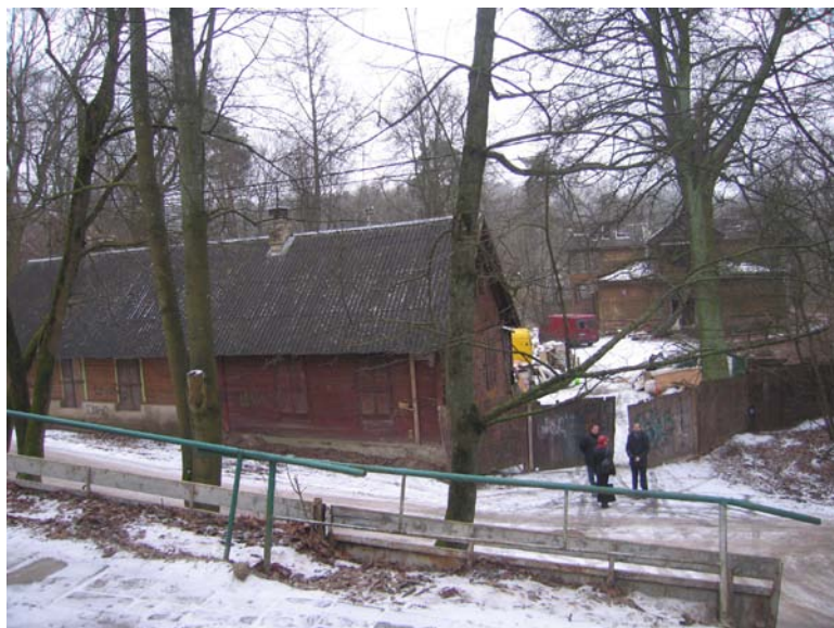
Vaizdas iš Š (nuo Pavasario g. pusės)