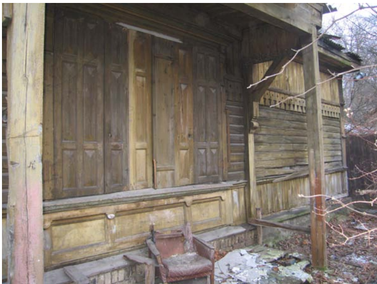
V fasado fragmentas