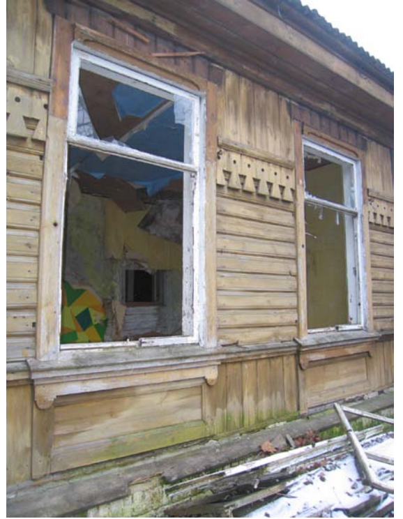
Fasado fragmentas V fasade