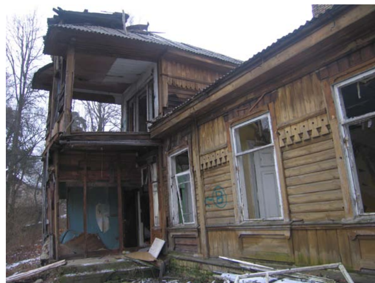
P fasado fragmentas