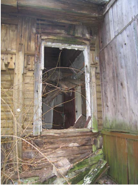
Fasado fragmentas V fasade