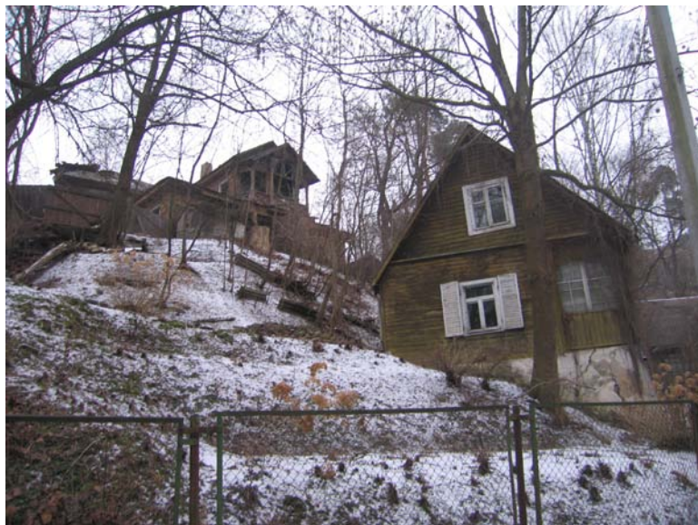
Vaizdas iš PV