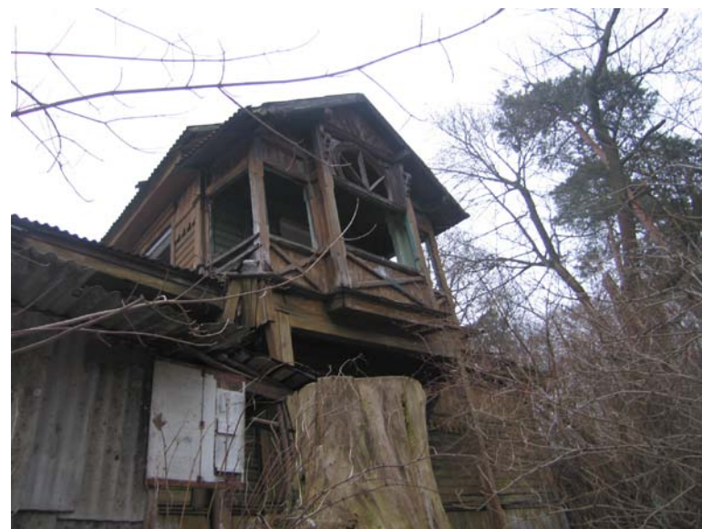
P fasado fragmentas