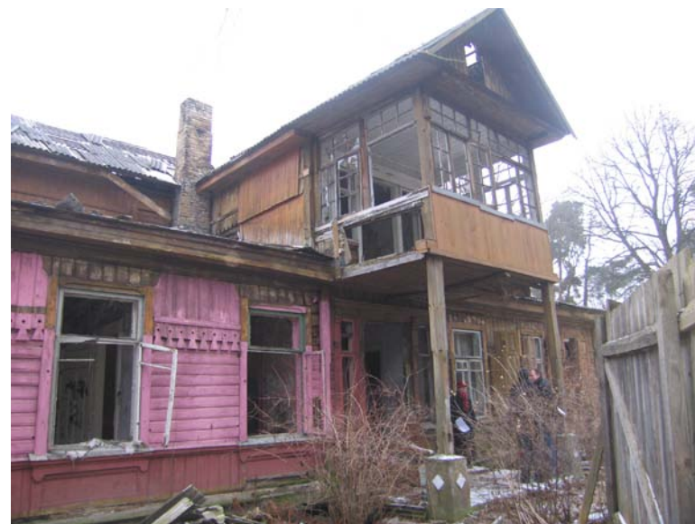
Vaizdas iš R