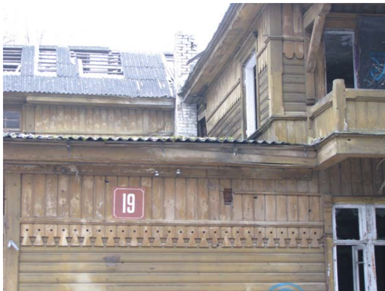
Š fasado fragmentas