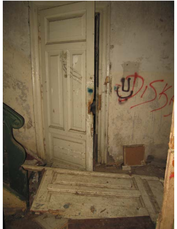
Durys iš patalpos 1-1 į patalpą 1-20