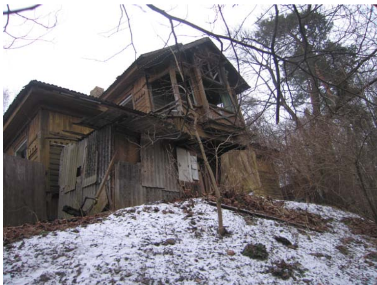
Vaizdas iš PV