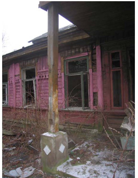
Fasado fragmentas R fasade