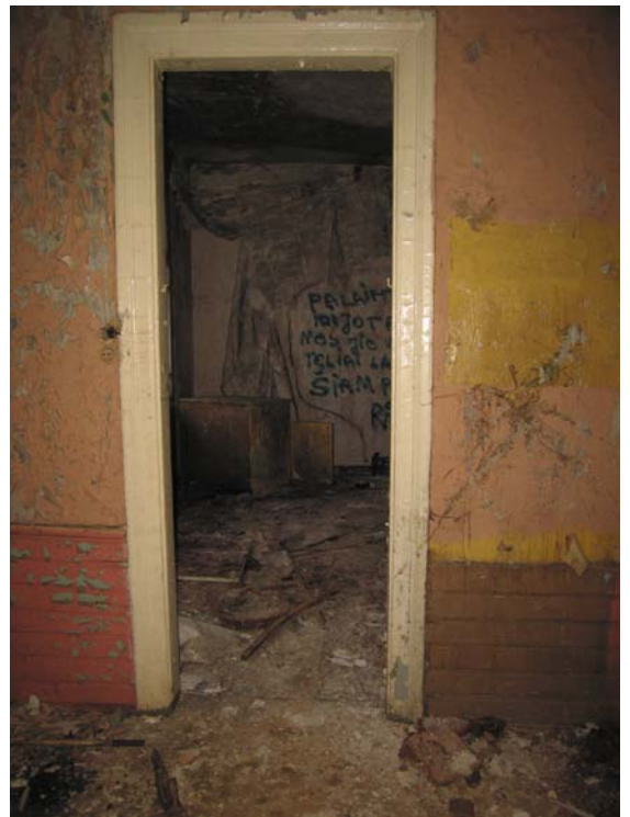
Vaizdas iš patalpos 1-6 į patalpą 1-7