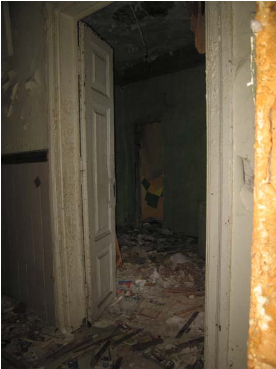
Vaizdas patalpoje 1-12