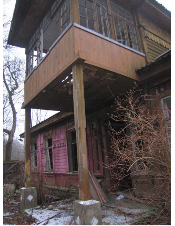
Fasado fragmentas R fasade