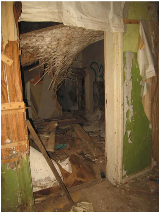
Vaizdas patalpoje 1-12