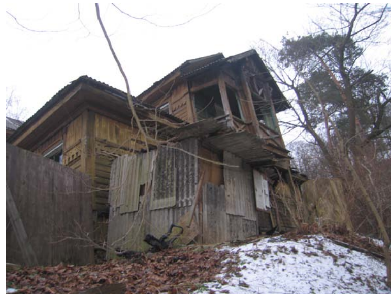
Vaizdas iš PV