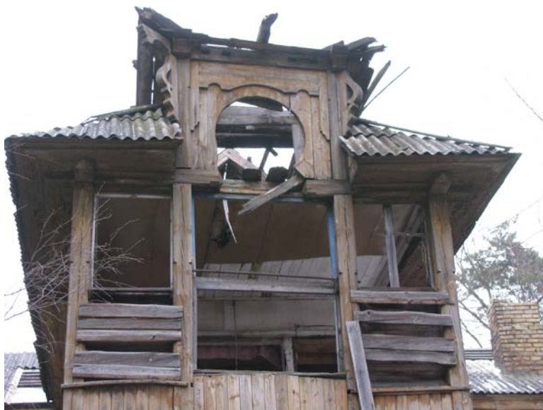
V fasado fragmentas