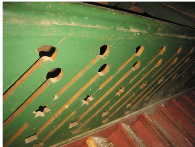
Laiptų turėklų fragmentas