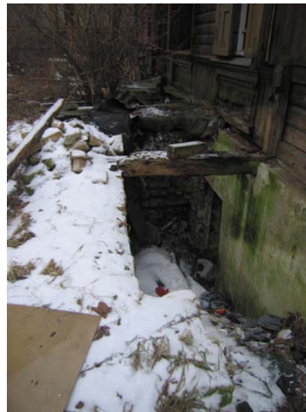
Įėjimas į rūšį R fasade