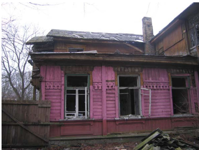
Vaizdas iš R