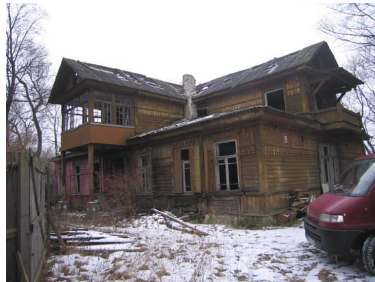
Vaizdas iš ŠV