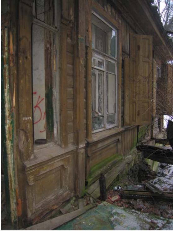
Fasado fragmentas V fasade