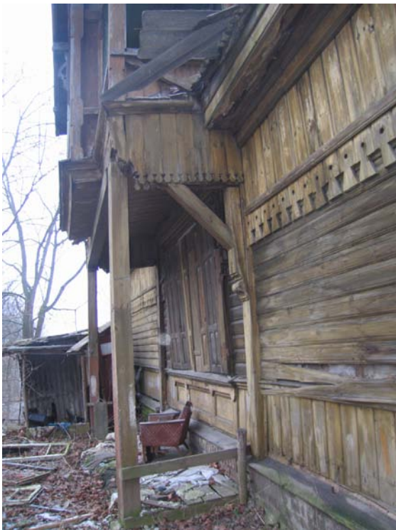
Fasado fragmentas P fasade