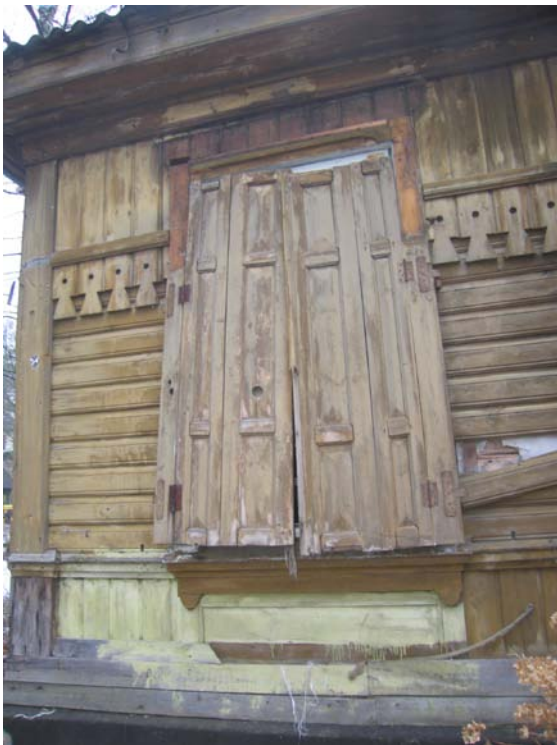
Fasado fragmentas V fasade