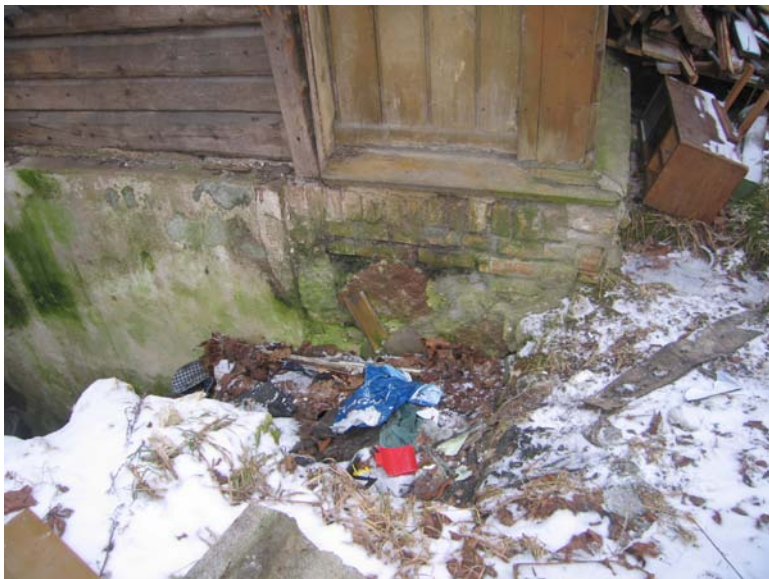
Pamatų fragmentas ties įėjimu į rūšį R fasade