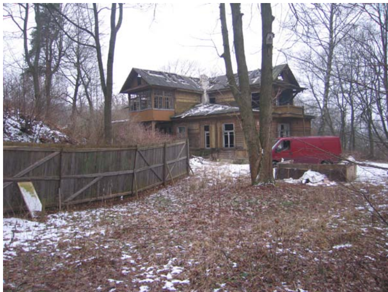
Vaizdas iš ŠV