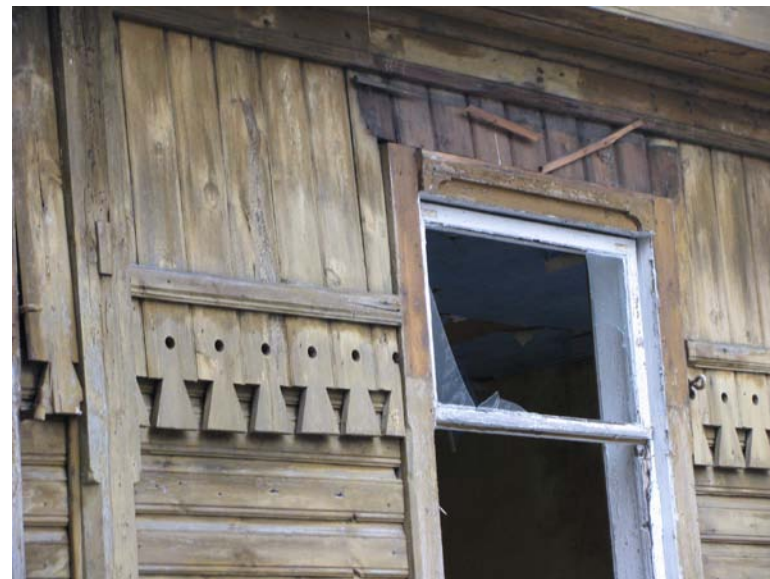
Š fasado fragmentas