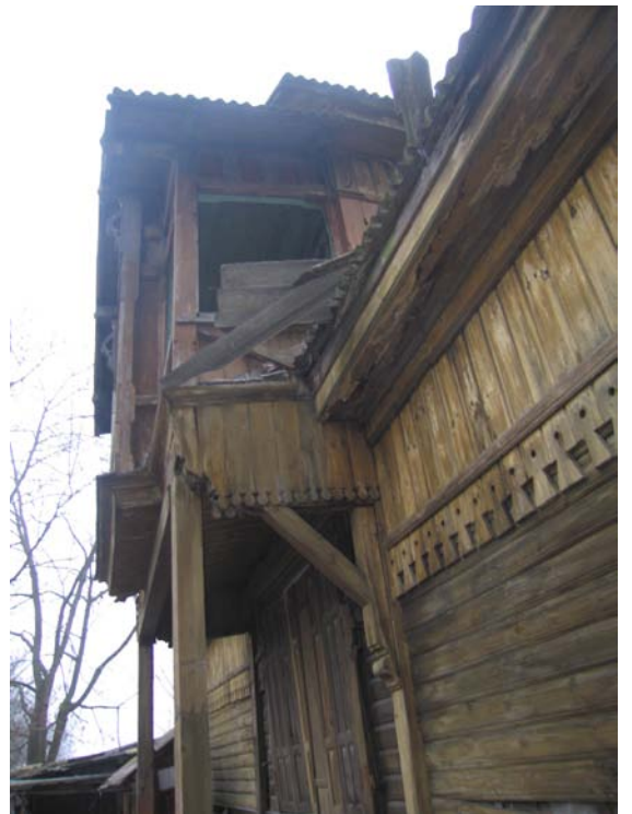
Fasado fragmentas P fasade