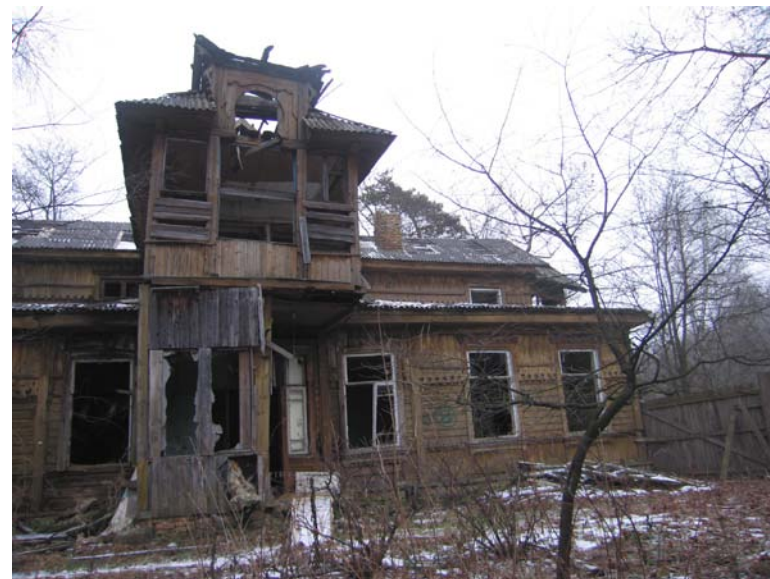
Vaizdas iš V