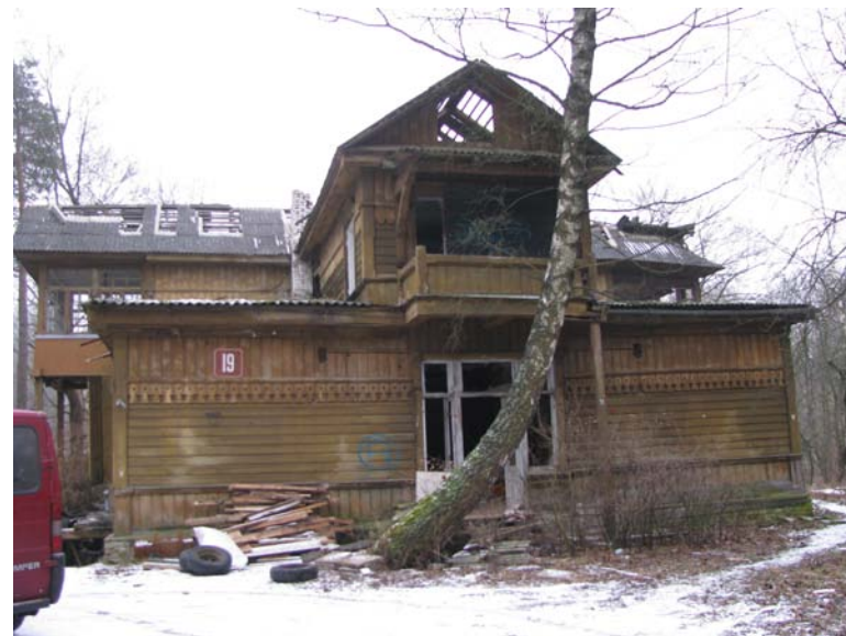
Vaizdas iš Š