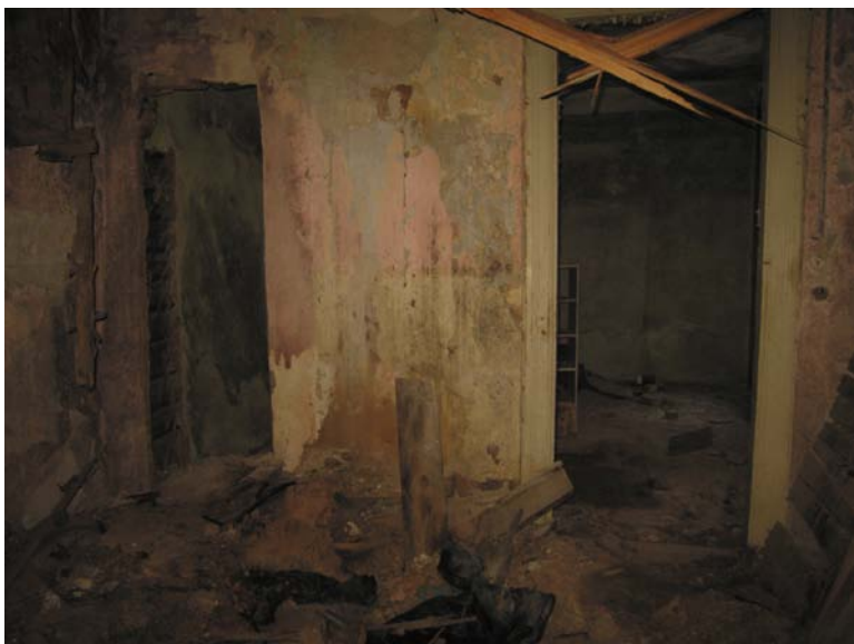
Vaizdas iš patalpos 1-12 į patalpą 1-11