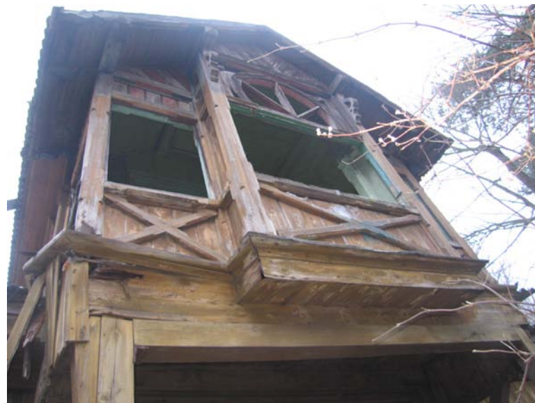
V fasado fragmentas