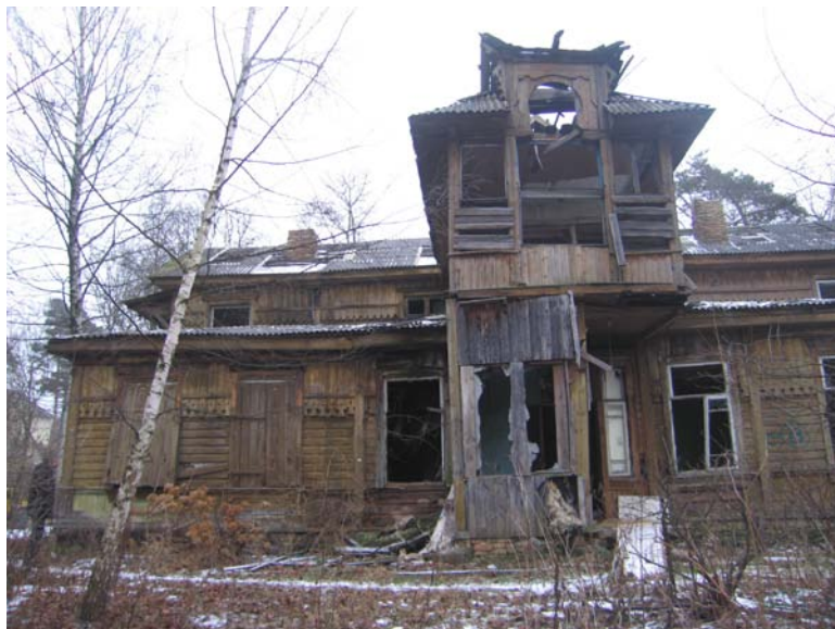
Vaizdas iš V