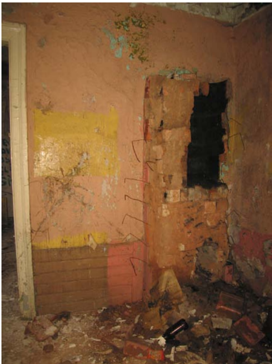
Vaizdas patalpoje 1-6