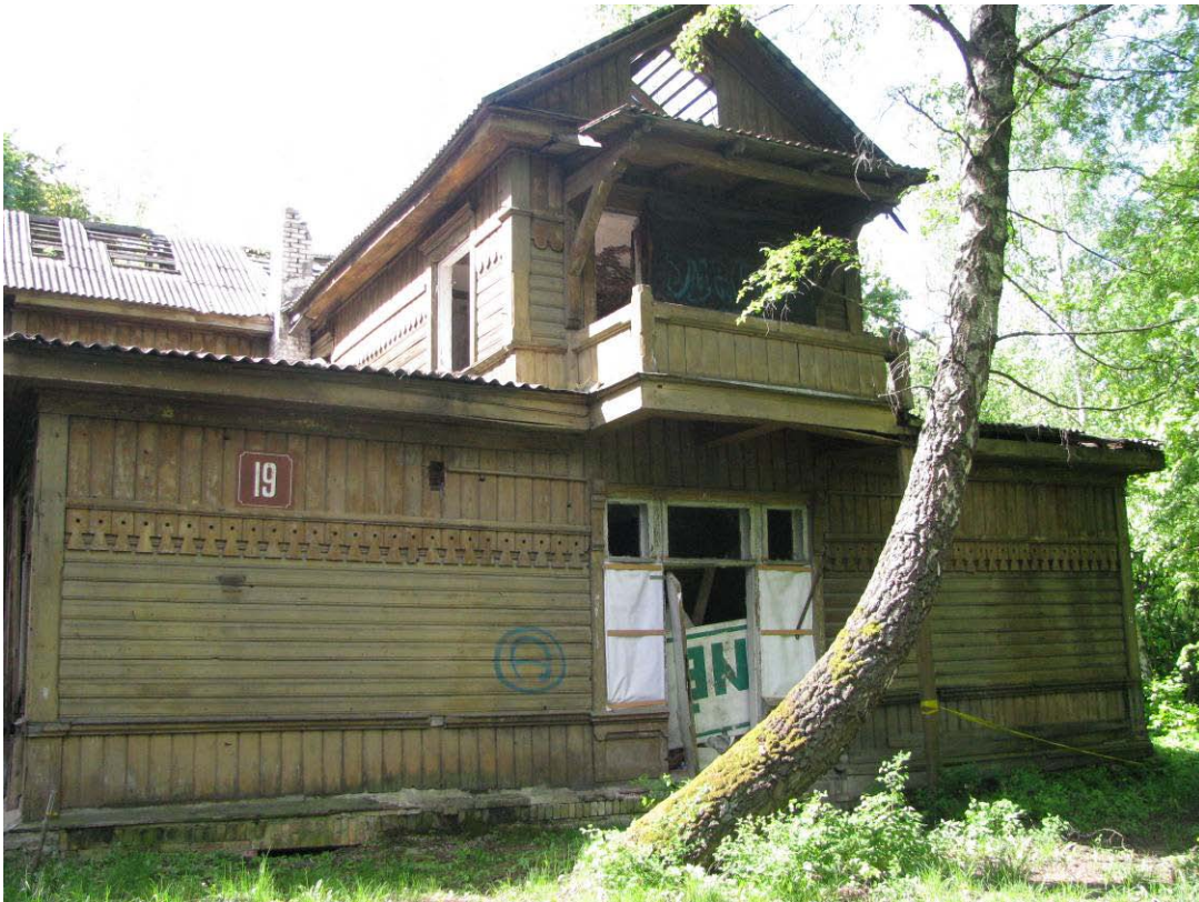
2. Š fasadas