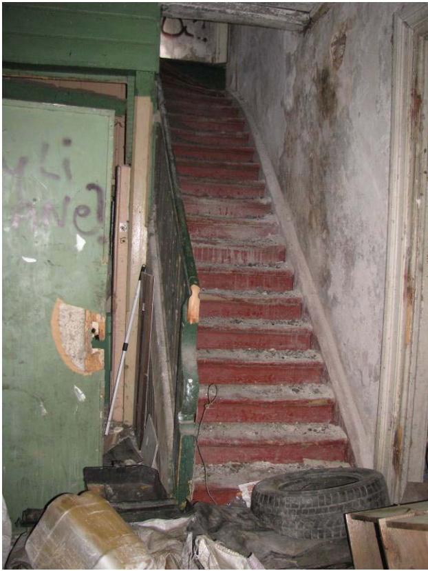
22-28. Mediniai vidaus laiptai