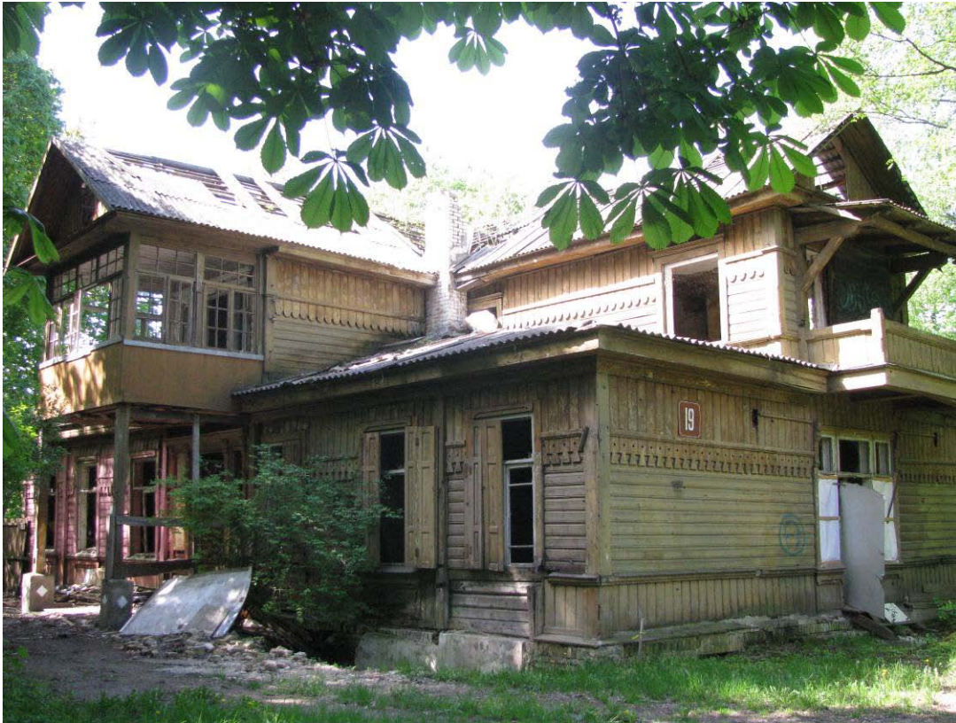
1. Namas Pavasario g. 19 (unikalus objekto kodas Kultūros vertybių registre 32216). Vaizdas iš ŠR