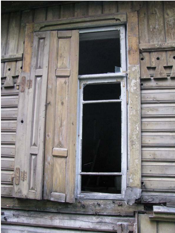
16-21. Rytų fasado fragmentai