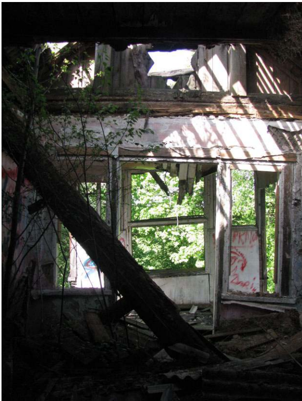
35-41. Antro aukšto patalpos