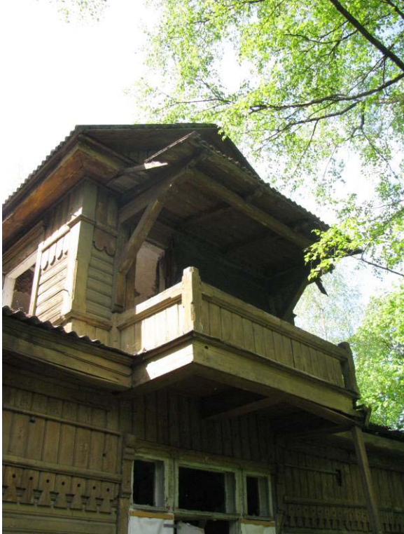
3-7. Š fasado fragmentai