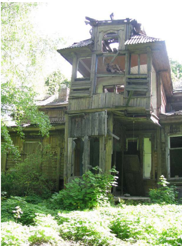
12-14. V fasadas