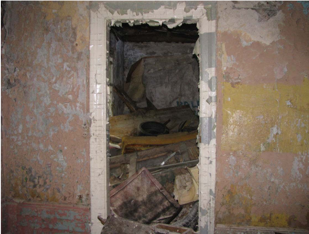
29-34. Pirmo aukšto patalpos