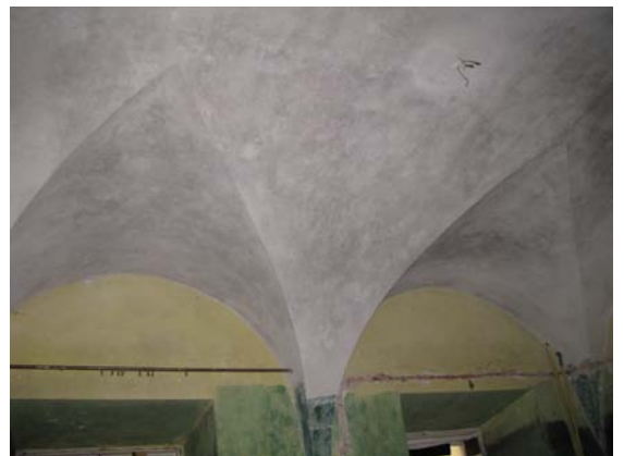
Skliautų patalpoje 1-24 fragmentas