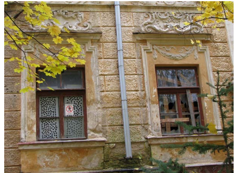
Vakarinio fasado pirmo a. langų dekoras