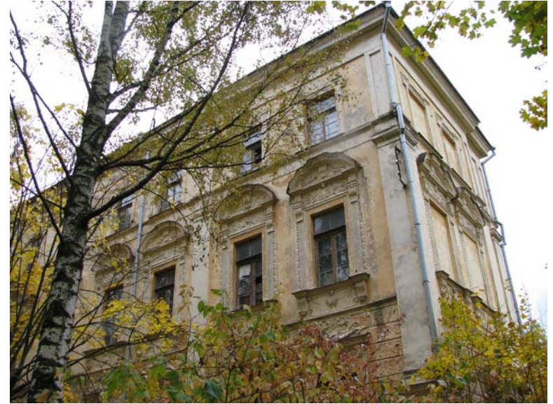
Vakarinio ir pietinio fasadų fragmentai