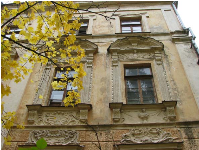
Vakarinio fasado antro a. langų dekoras