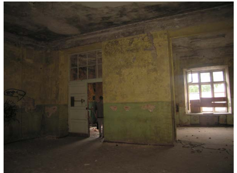
Vaizdas iš patalpos 2-6 į patalpą 2-7