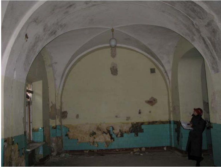
Vaizdas patalpoje 1-9