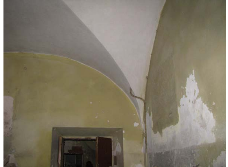
Patalpos 1-18 fragmentas