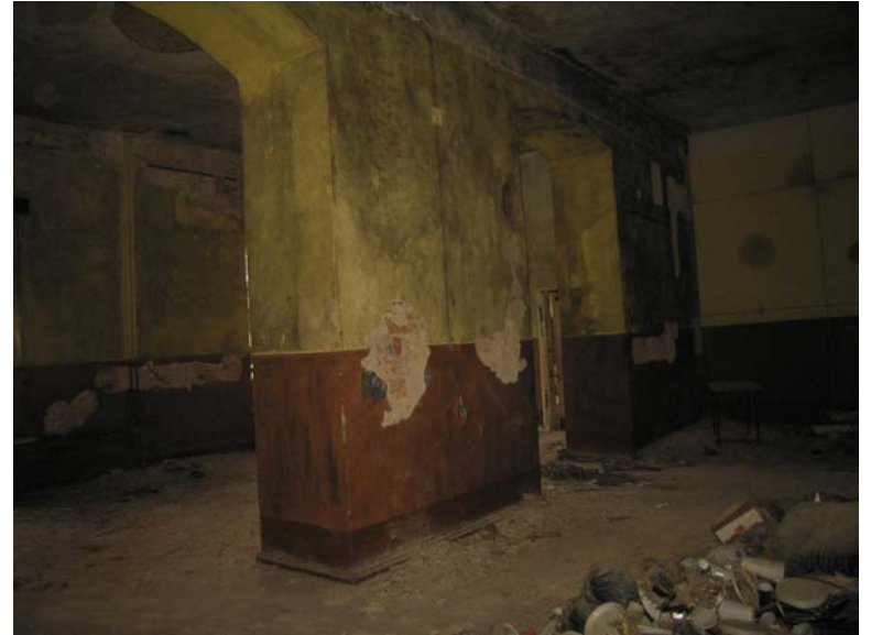
Patalpos 2-16 fragmentas