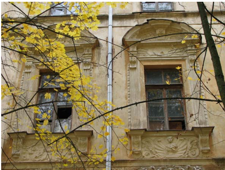
Vakarinio fasado antro a. langų dekoras