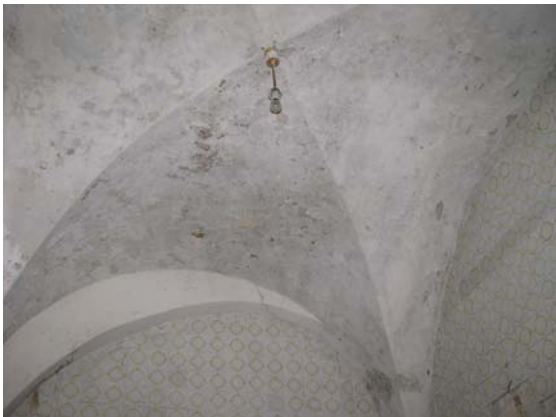
Skliautų patalpoje 1-21 fragmentas