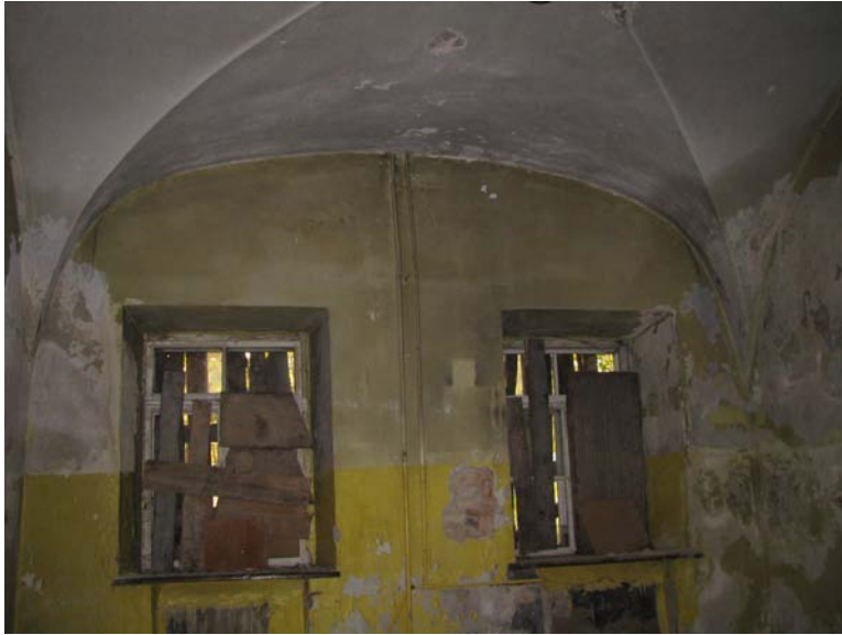
Patalpos 1-18 fragmentas