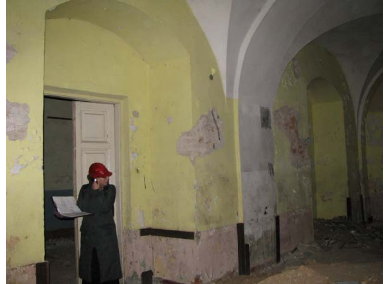
Vaizdas patalpoje 1-19