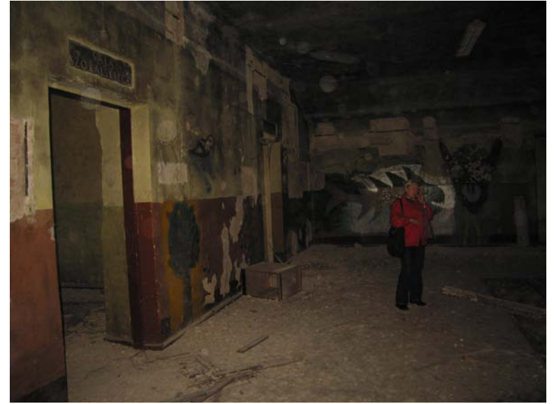
Vaizdas patalpoje 2-1