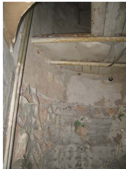
Patalpos 2-3 fragmentas