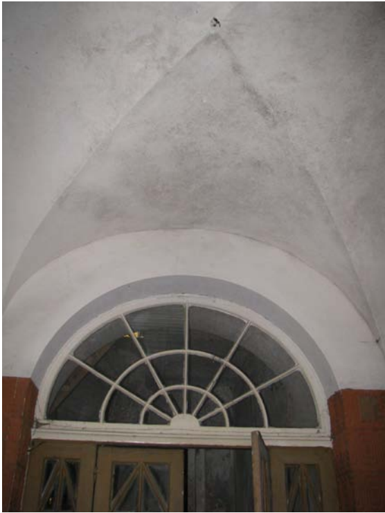
Skliauto fragmentas patalpoje 1-1