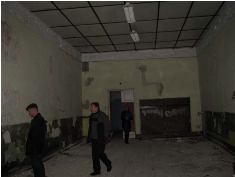
Vaizdas patalpoje 1-2