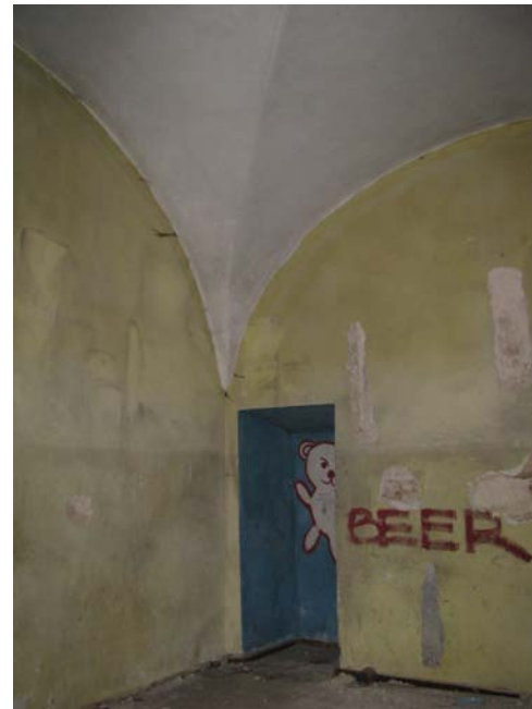
Niša patalpoje 1-18