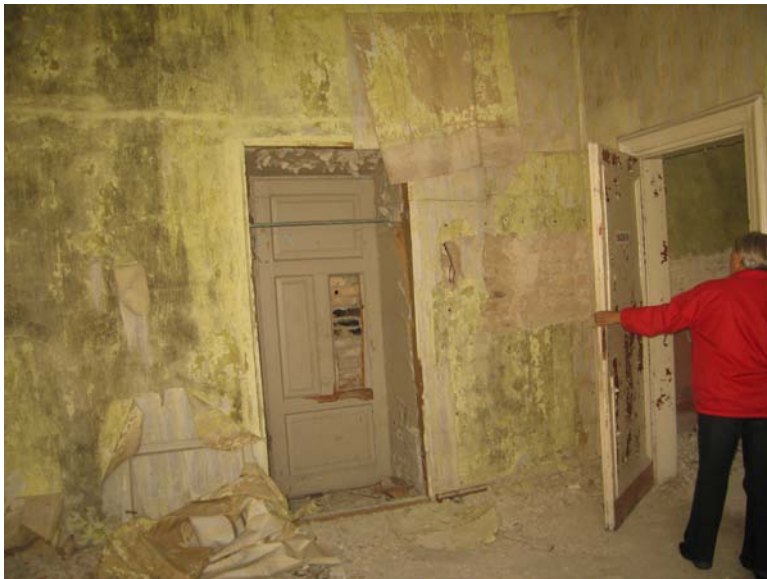
Patalpos 2-18 fragmentas