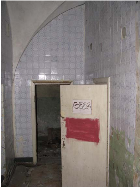
Vaizdas patalpoje 1-13