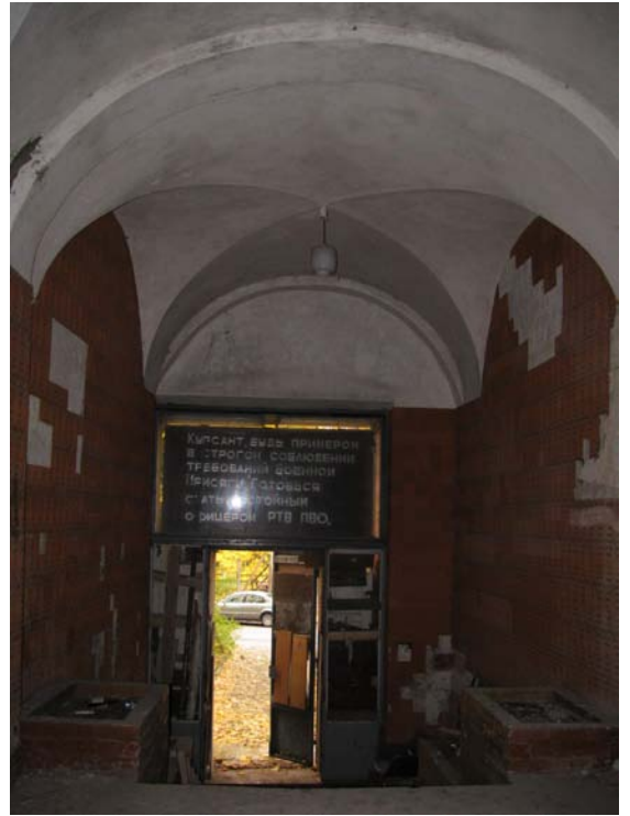
Vaizdas patalpoje 1-1