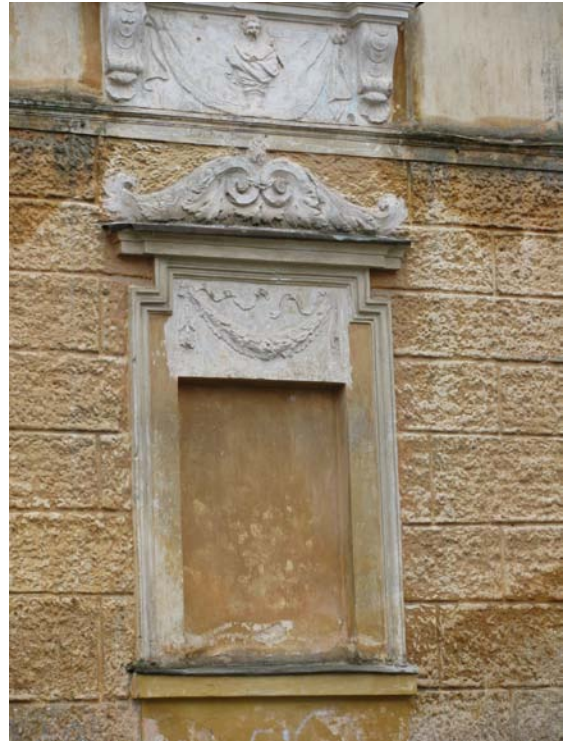
Rizalito pirmo a. dekoras