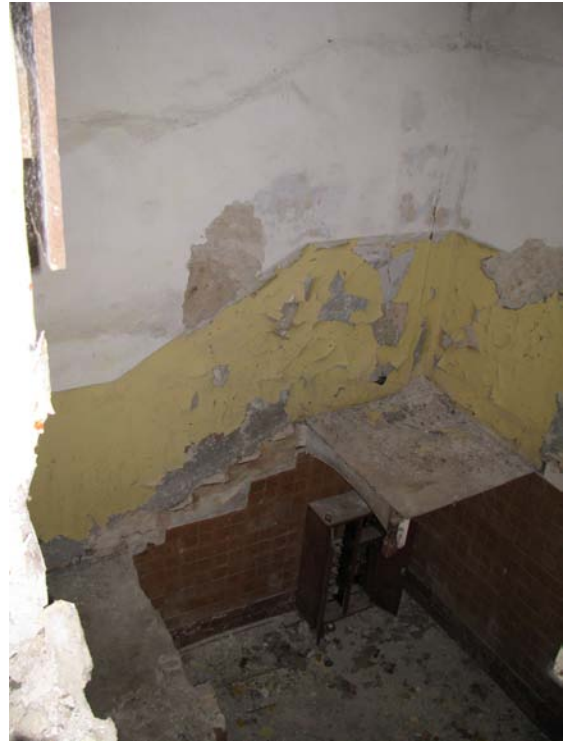
Vaizdas laiptinėje (2-9, 1-10)