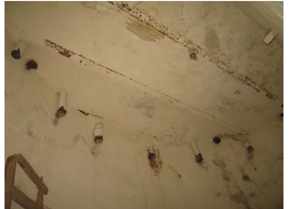
Lubų patalpoje 3-10 fragmentas