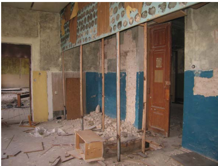
Vaizdas patalpoje 3-4