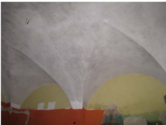
Skliautų patalpoje 1-24 fragmentas