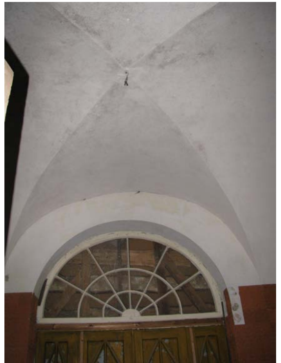
Skliauto fragmentas patalpoje 1-1