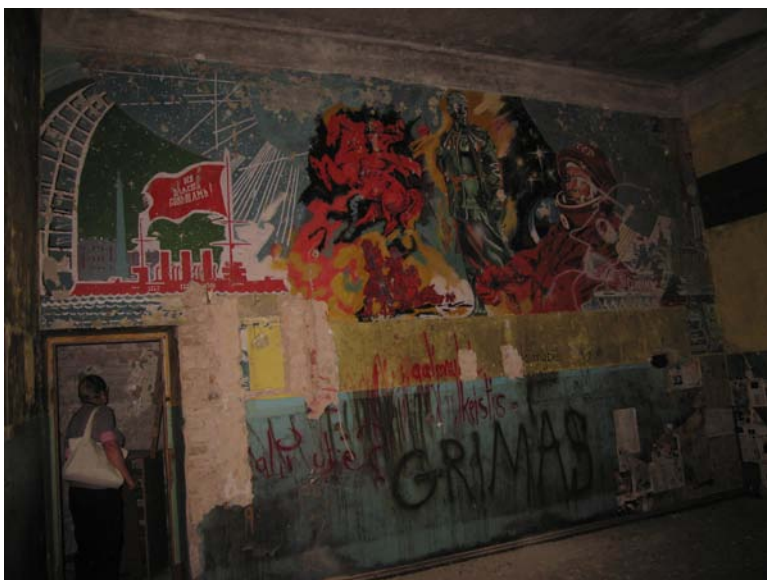
Vaizdas patalpoje 2-3