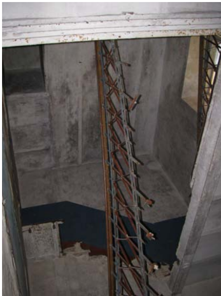
Vaizdas laiptinēje (1-23, 3-7)