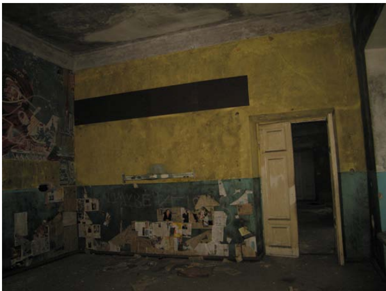
Vaizdas patalpoje 2-3