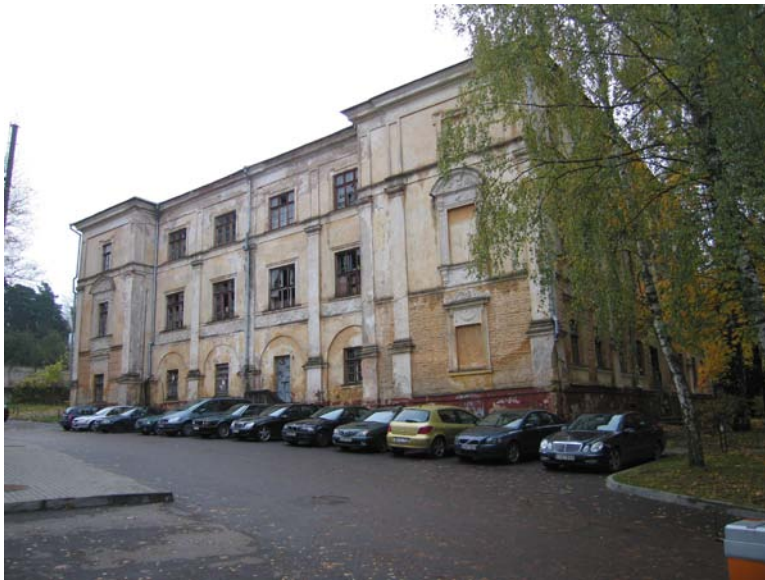
Rūmų šiaurinis fasadas