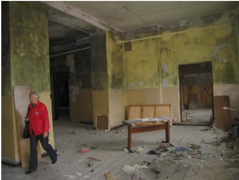
Vaizdas patalpoje 3-5