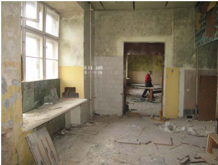
Vaizdas patalpoje 3-4