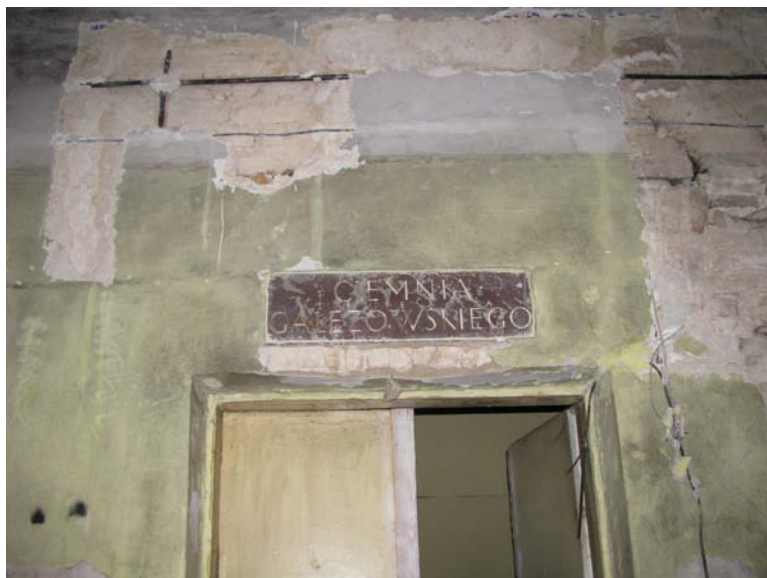
Lentelė virš durų patalpoje 2-1