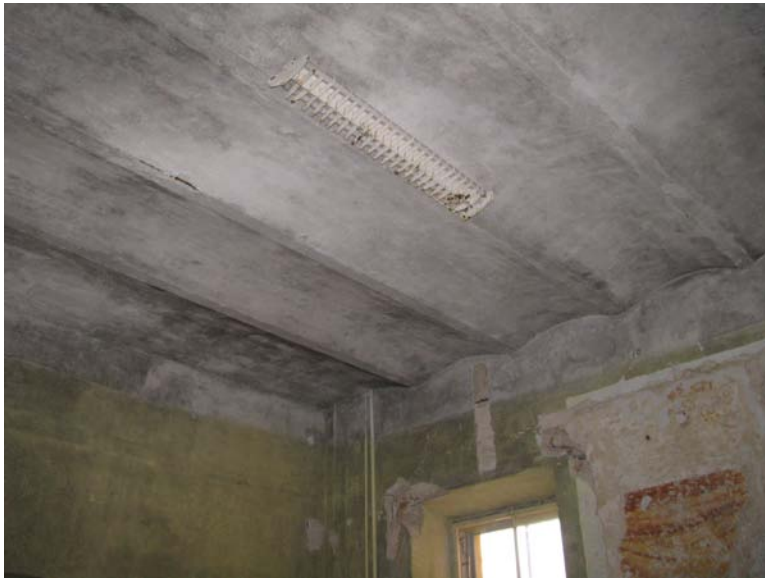
Lubos patalpoje 2-10