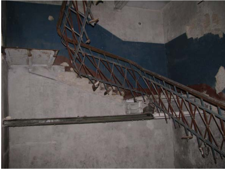
Vaizdas laiptinēje (1-23, 3-7)