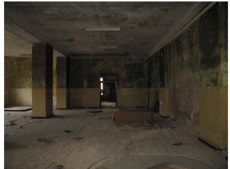
Vaizdas patalpoje 3-6