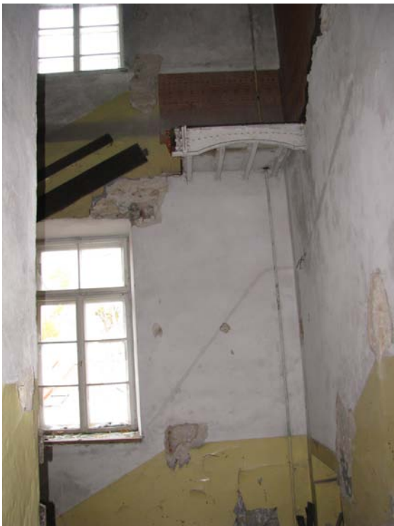
Vaizdas laiptinėje (2-9, 3-7)