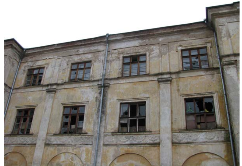
Šiaurinio fasado fragmentas