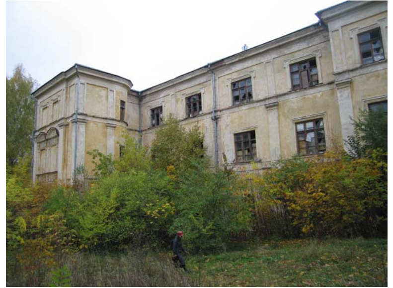
Pietinio fasado fragmentas