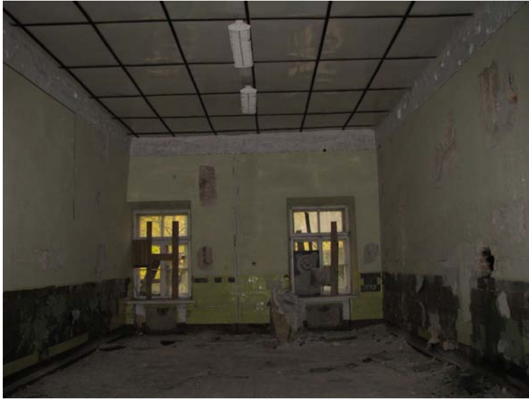
Vaizdas patalpoje 1-2