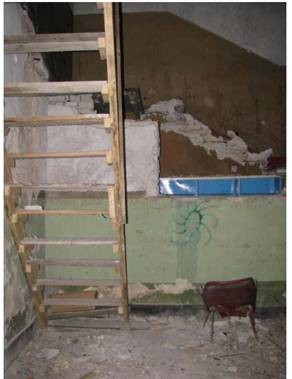
Vaizdas laiptinėje (1-23, 1-22)