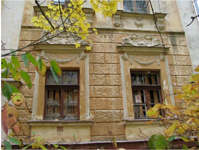
Vakarinio fasado pirmo a. langų dekoras