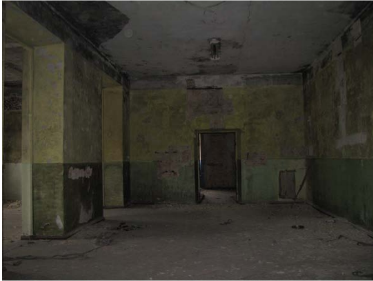
Vaizdas patalpoje 2-6