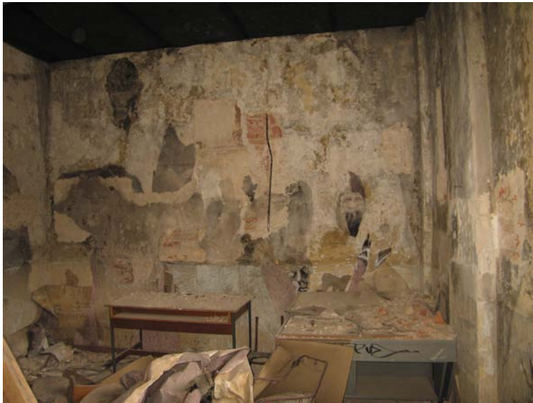
Vaizdas patalpoje 2-4