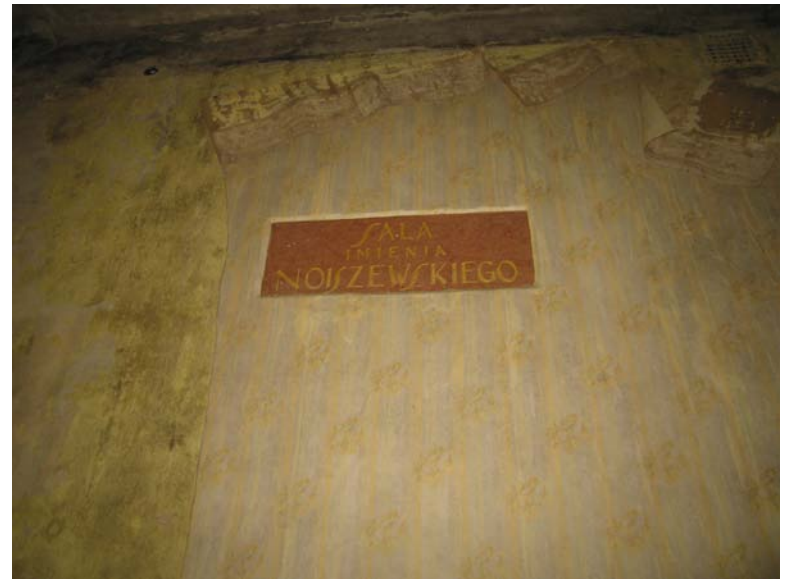
Lentelė patalpoje 2-18