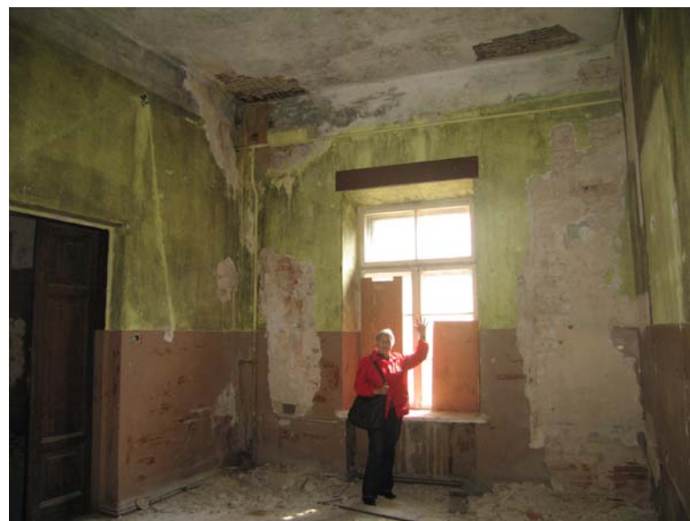
Vaizdas patalpoje 3-11