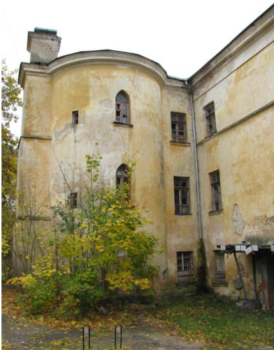
Rytinis bokštas ir jungtis su pastatu