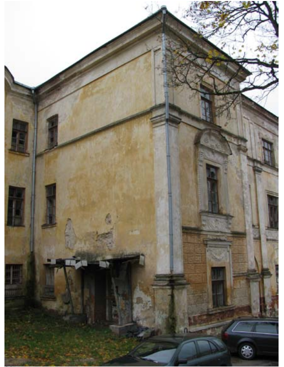
Šiaurinio fasado rizalitas ir jungtis su bokštu