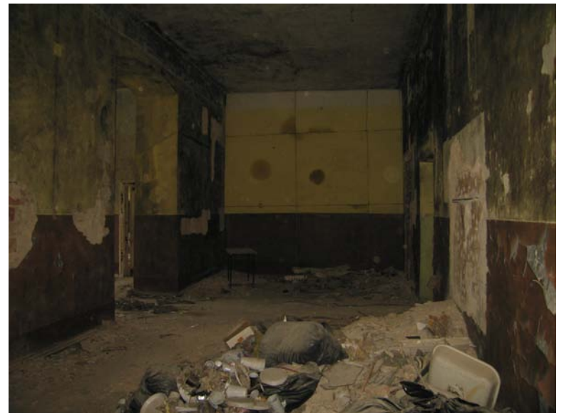
Patalpos 2-16 fragmentas