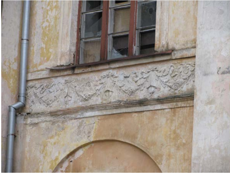
Dekoras po antro aukšto langu šiauriniame fasade