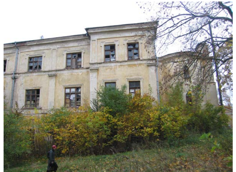
Pietinio fasado fragmentas