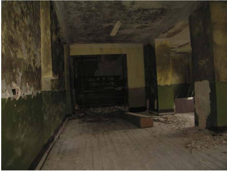
Vaizdas patalpoje 3-14