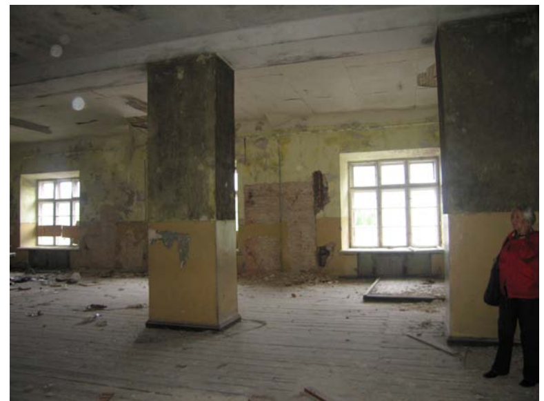
Vaizdas iš patalpos 3-6 į patalpą 3-5