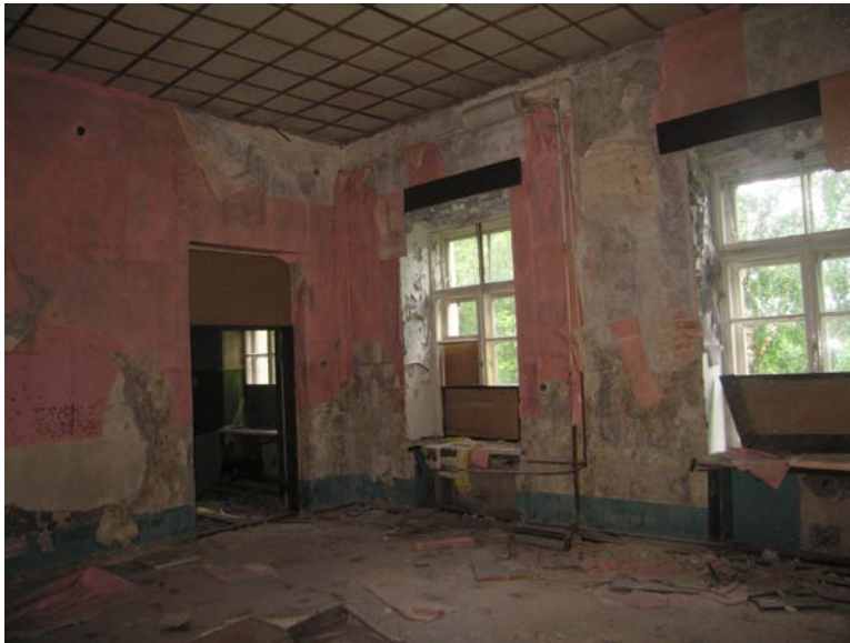
Patalpos 3-2 fragmentas