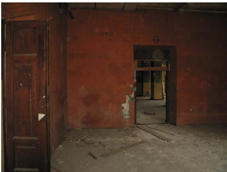
Vaizdas patalpoje 3-8