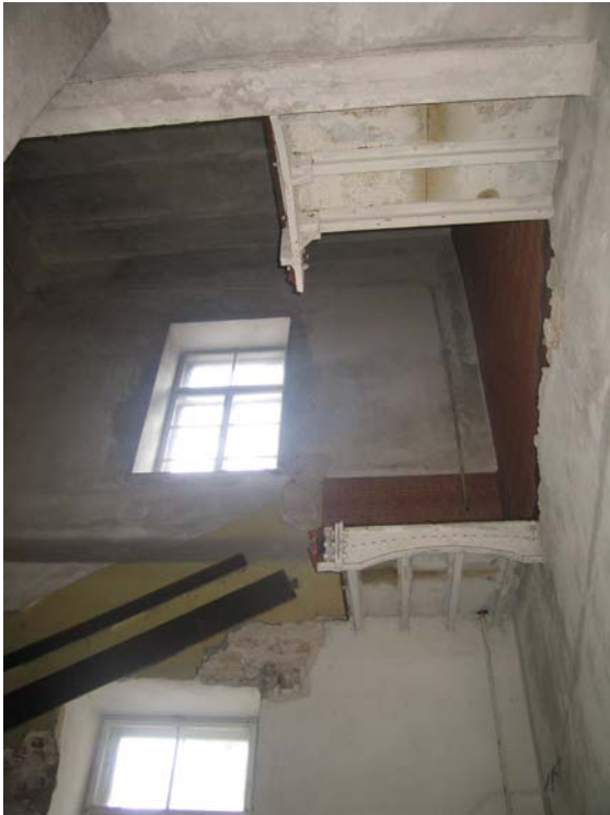
Vaizdas laiptinėje (2-9, 3-7)