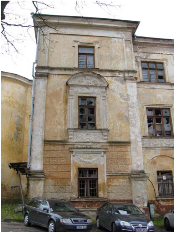
Šiaurinio fasado fragmentas - rizalitas