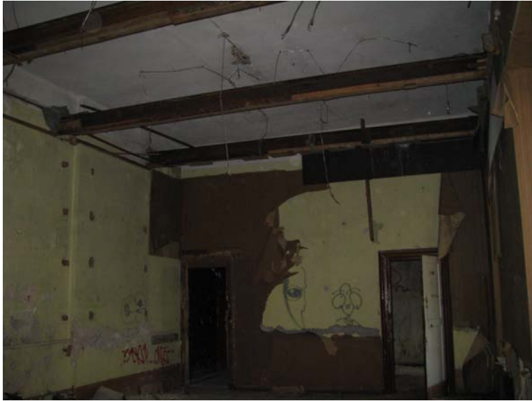
Vaizdas patalpoje 2-19