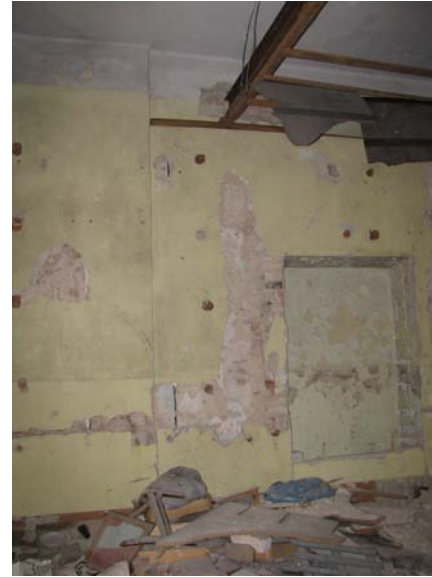
Niša patalpoje 2-19