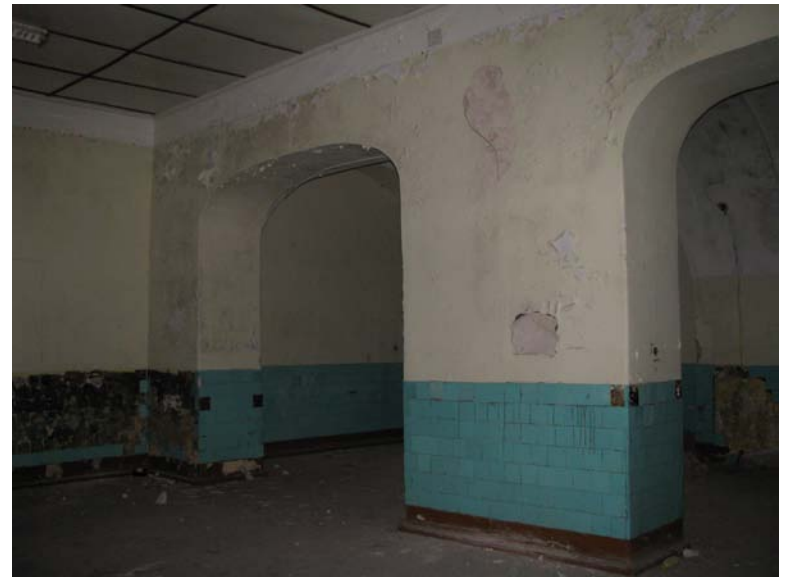
Vaizdas patalpoje 1-8