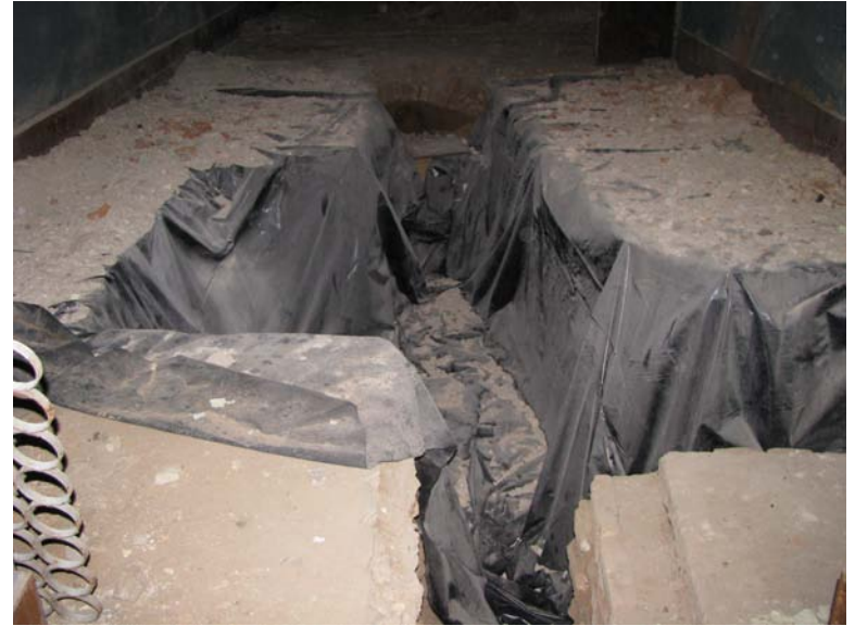
Vaizdas patalpoje 1-20