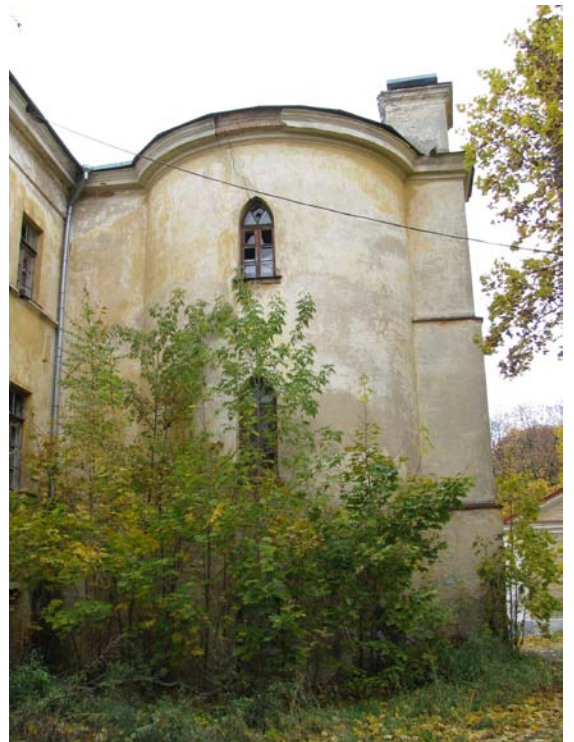
Rytinis bokštas ir jungtis su pastatu