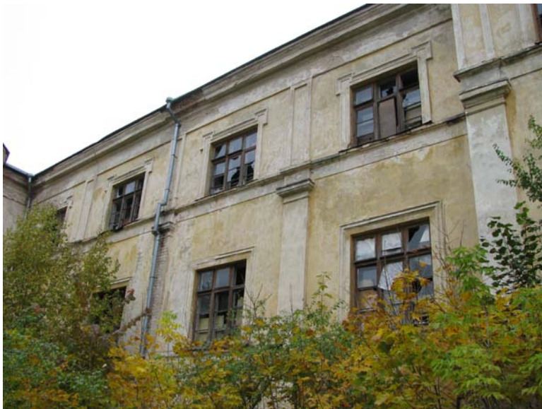
Pietinio fasado fragmentas