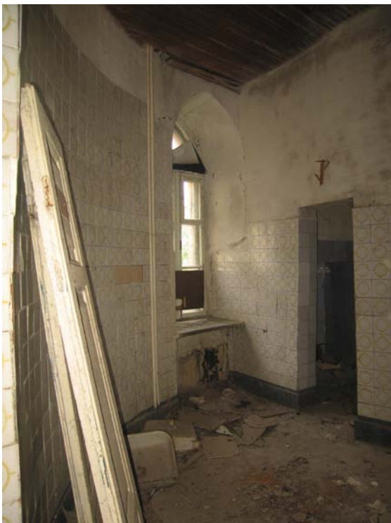
Vaizdas patalpoje 3-9