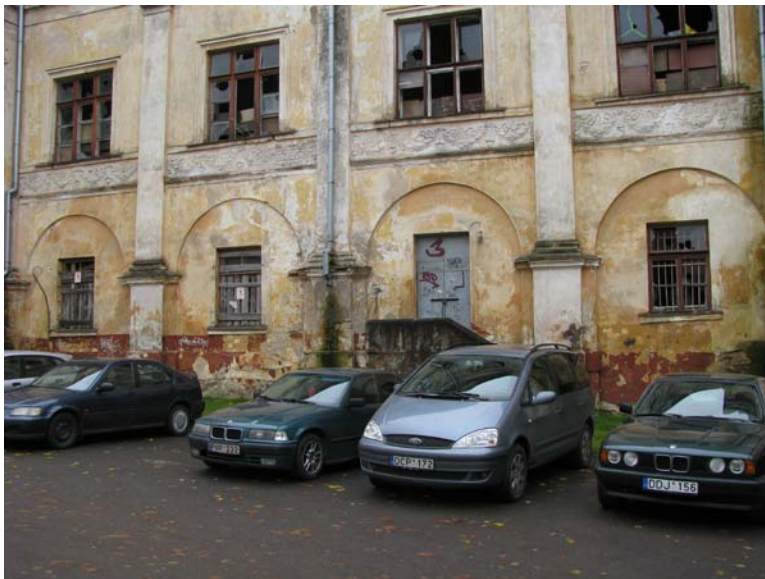
Šiaurinio fasado fragmentas