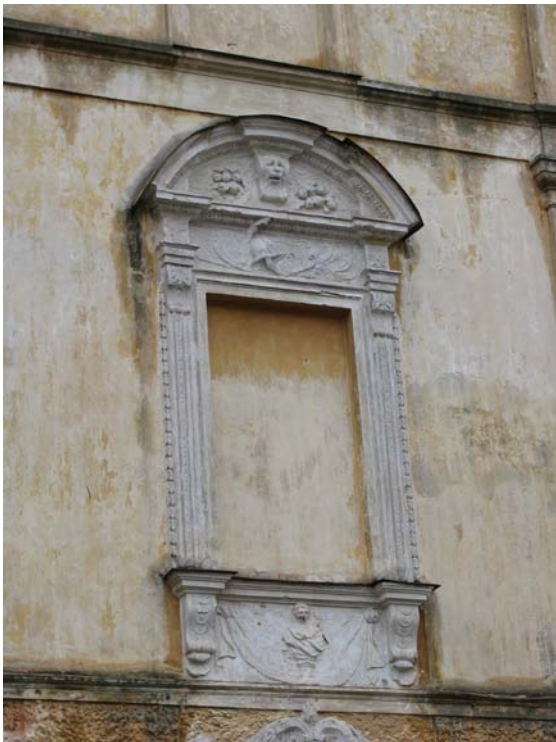
Rizalito antro a. dekoras