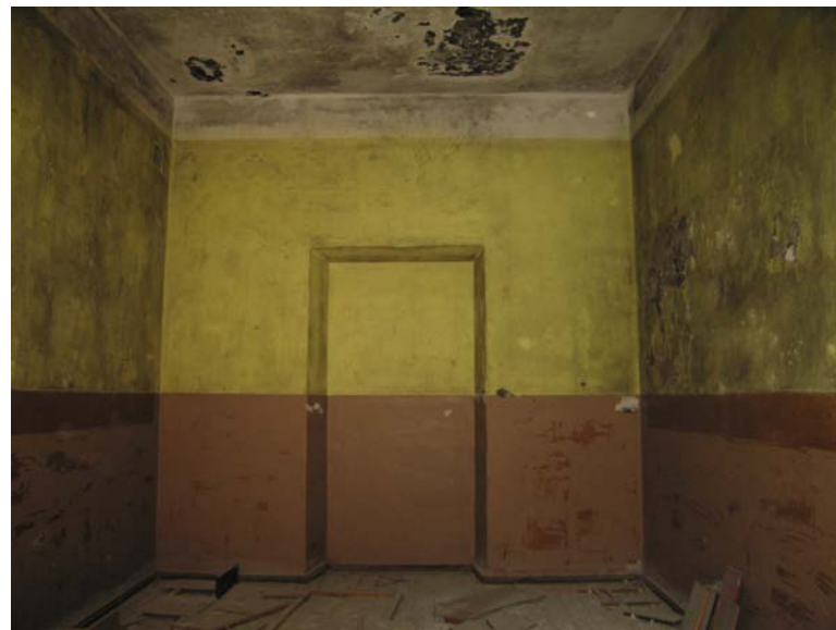
Niša patalpoje 3-11