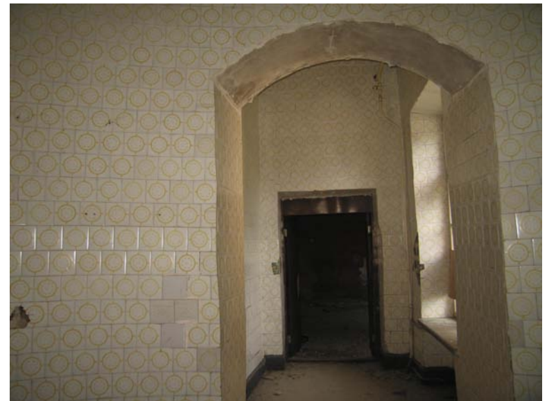
Vaizdas iš patalpos 3-9 į patalpą 3-8