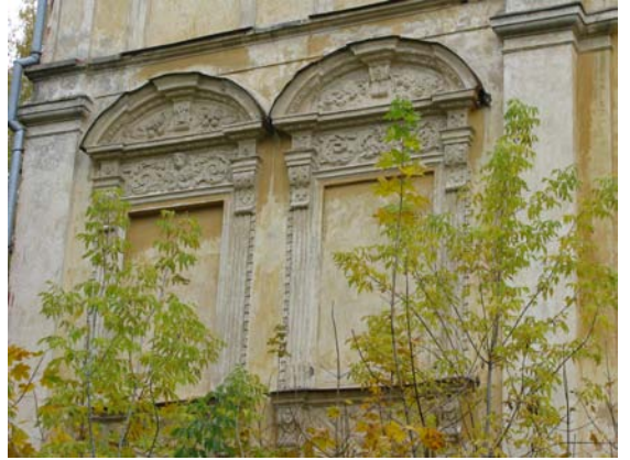
Rizalito antro a. dekoras