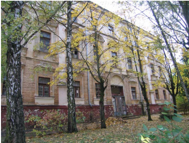
Vakarinis fasadas L.Sapiegos g.