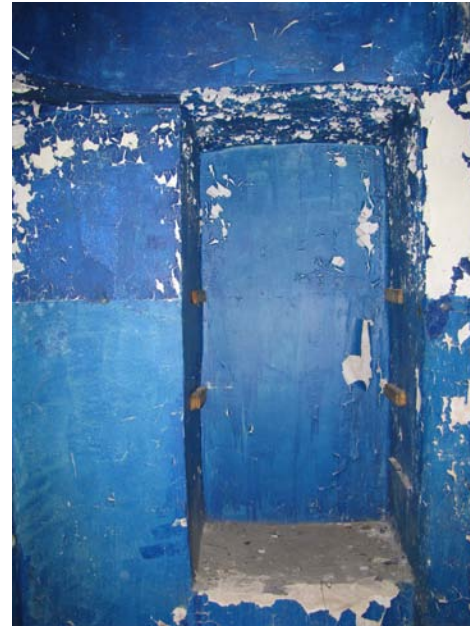
Niša patalpoje 1-27