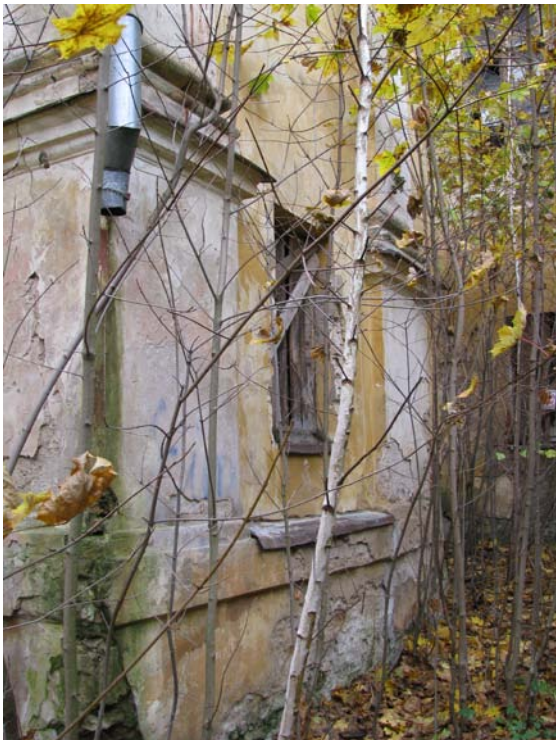
Rizalito pietiniame fasade fragmentas