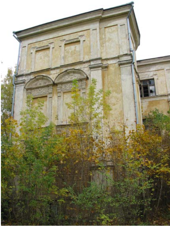
Rizalitas pietiniame fasade