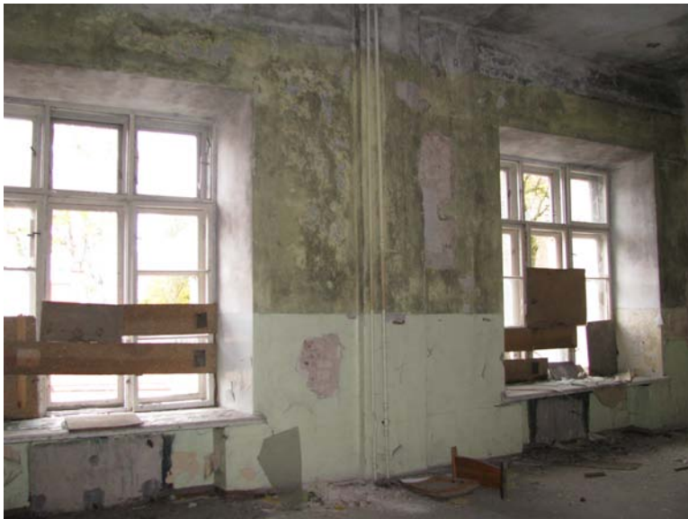
Vaizdas patalpoje 2-7