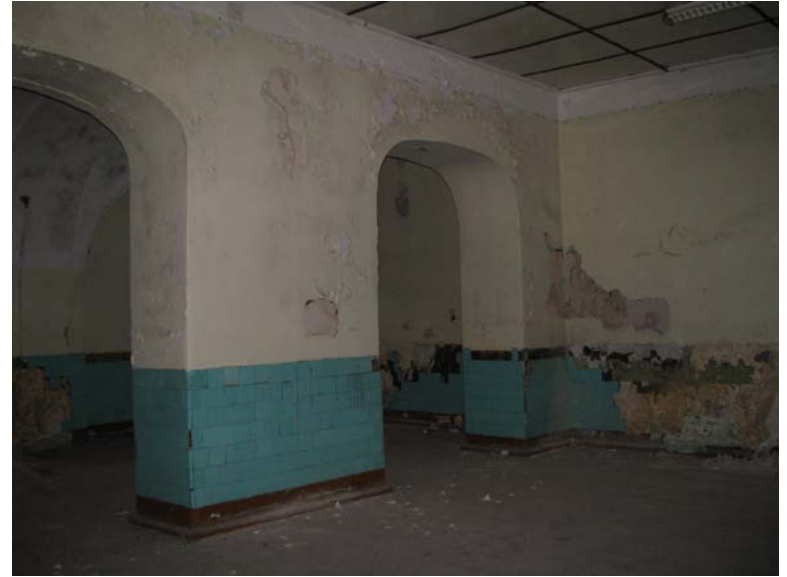
Vaizdas patalpoje 1-8