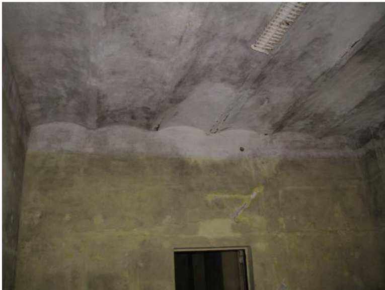
Lubos patalpoje 2-10