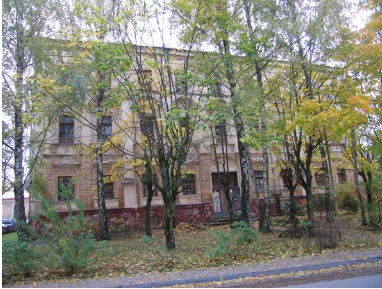
Vakarinis fasadas L.Sapiegos g.