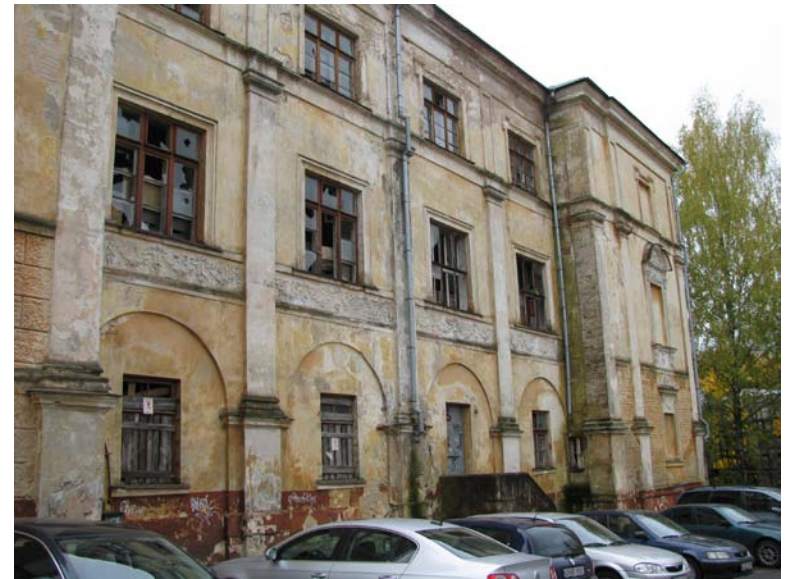
Šiaurinio fasado fragmentas