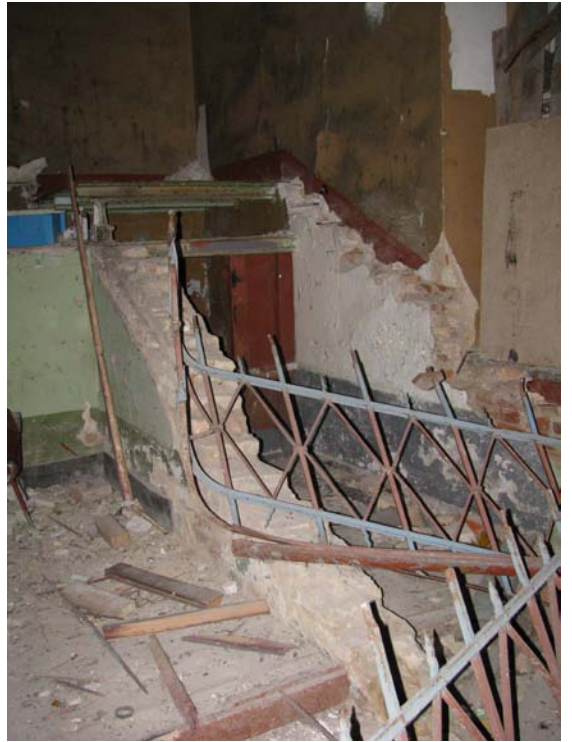
Vaizdas laiptinėje (1-23, 1-22)