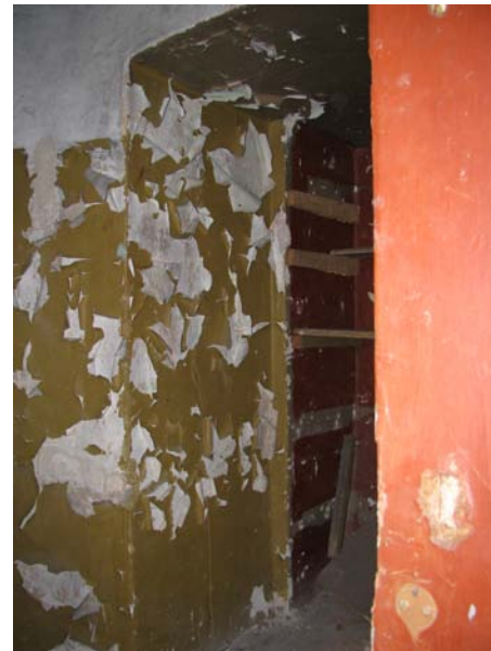
Niša patalpoje 2-22