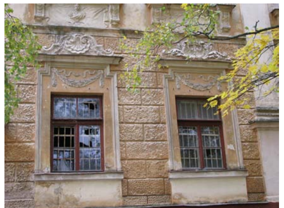
Pirmo a. langų dekoras