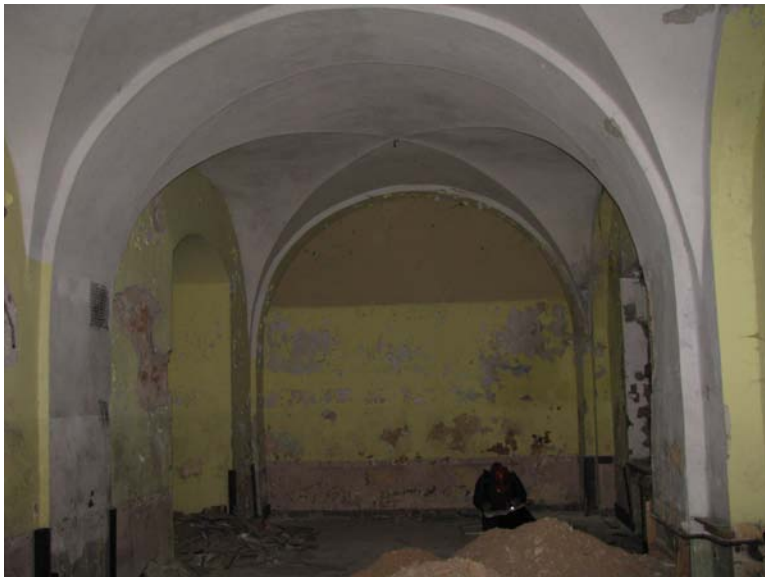
Vaizdas patalpoje 1-19