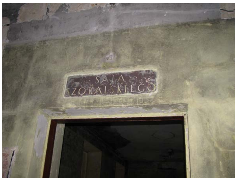
Lentelė virš durų patalpoje 2-1