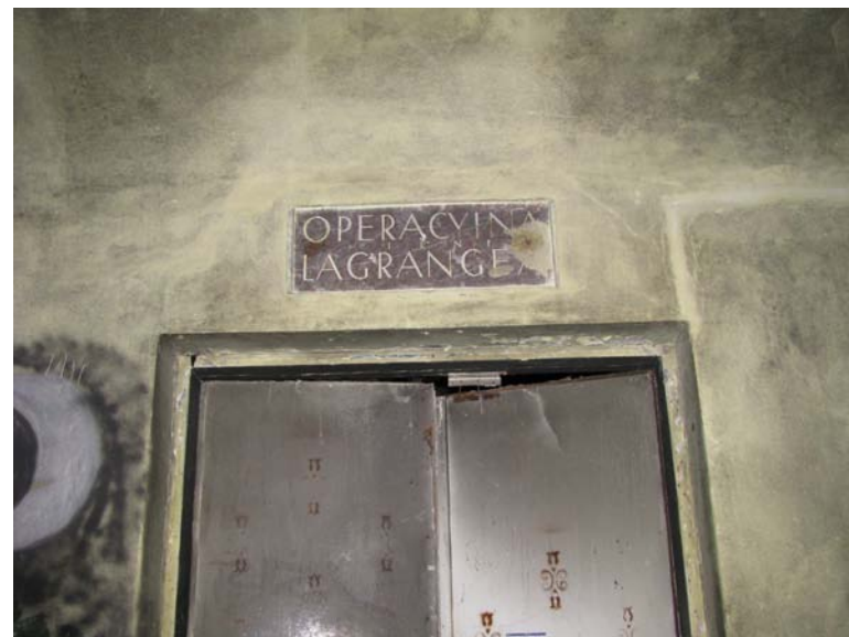
Lentelė virš durų patalpoje 2-1