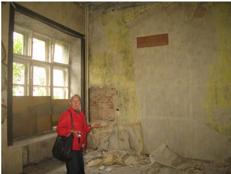
Patalpos 2-18 fragmentas