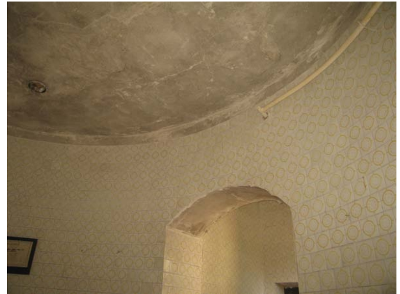
Vaizdas patalpoje 3-9