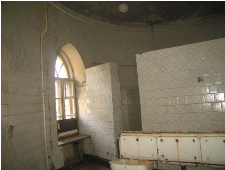
Vaizdas patalpoje 3-9