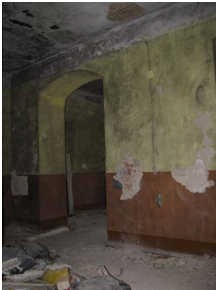
Patalpos 2-16 fragmentas