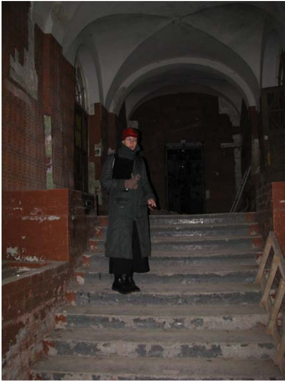
Vaizdas patalpoje 1-1