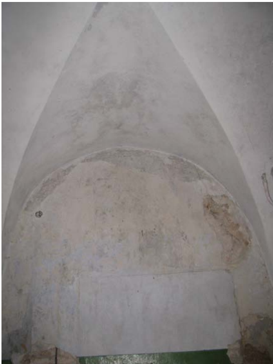
Skliauto patalpoje 1-11 fragmentas