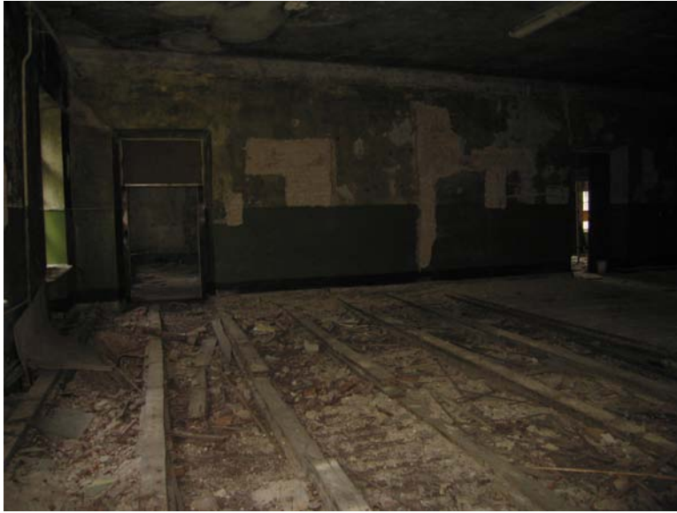
Vaizdas patalpoje 3-1