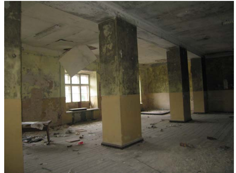
Vaizdas patalpoje 3-6