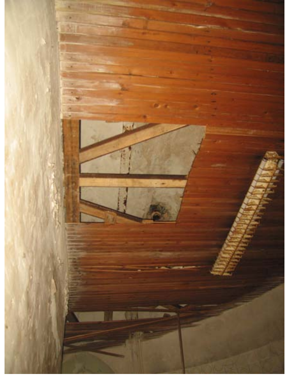
Lubų patalpoje 3-9 fragmentas