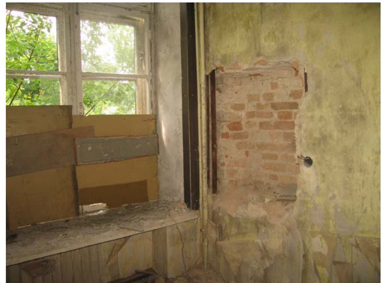
Zondažas patalpoje 2-18