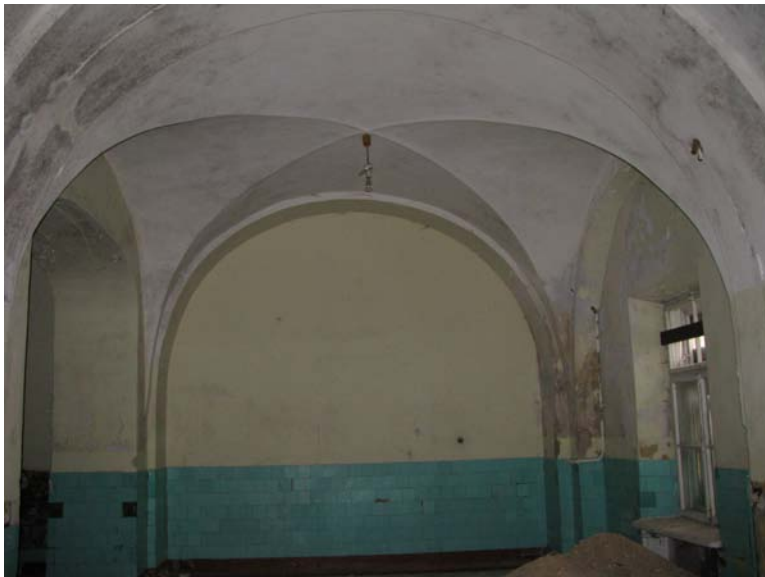
Vaizdas patalpoje 1-9