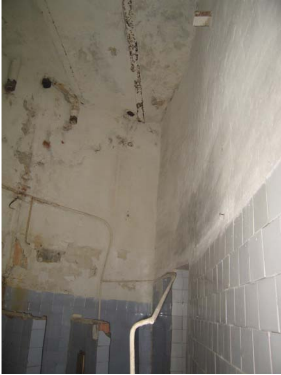
Patalpos 3-10 fragmentas