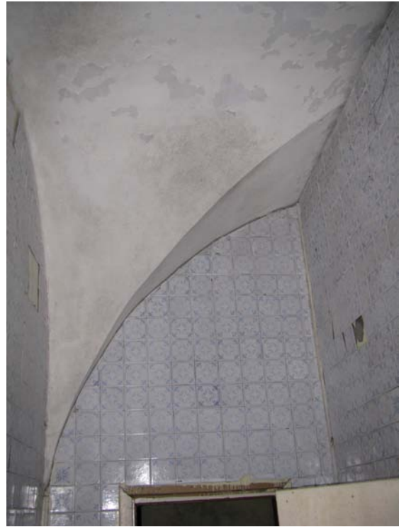
Skliautas patalpoje 1-13