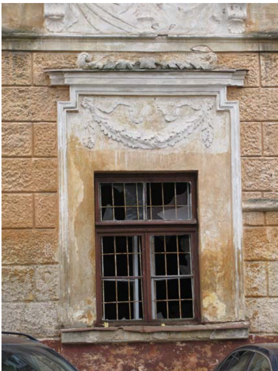
Rizalito pirmo a. dekoras