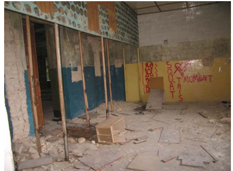
Vaizdas patalpoje 3-4