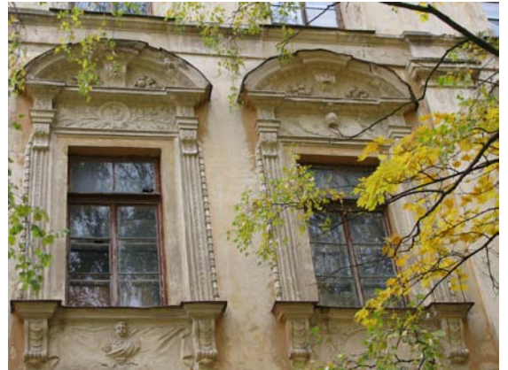
Antro a. langų dekoras