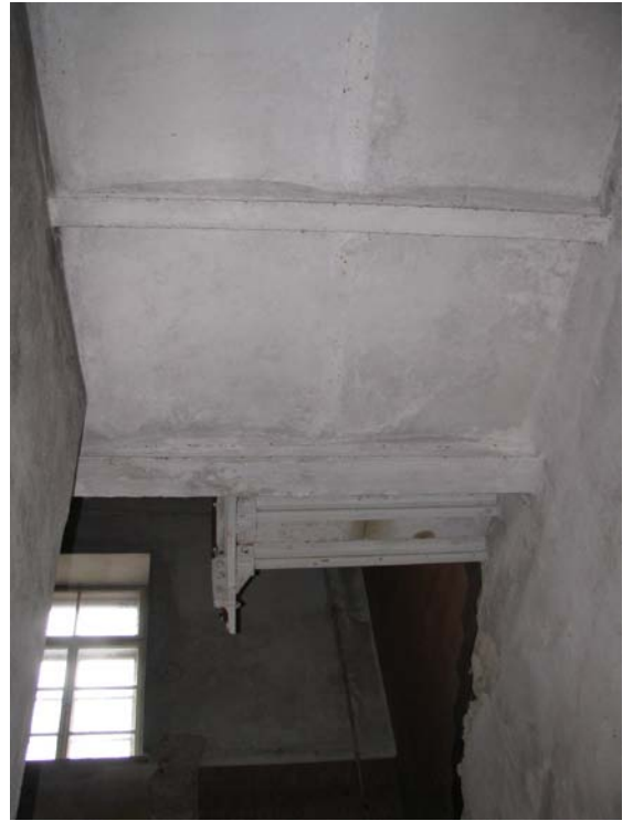
Vaizdas laiptinėje (2-9, 3-7)