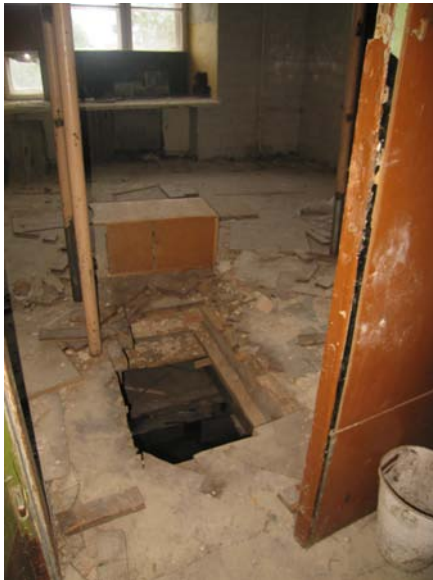
Patekimo iš antro a. į trečio a. patalpą 3-4 anga