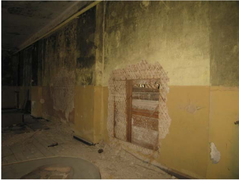
Siena patalpoje 3-6