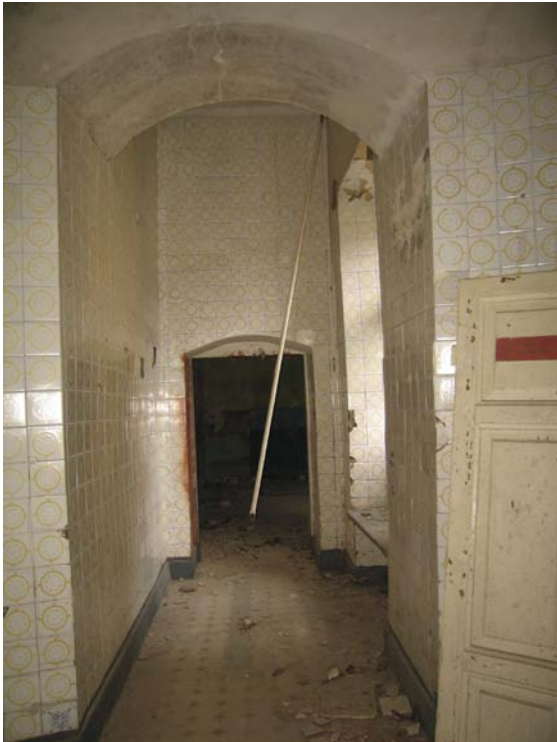
Vaizdas iš patalpos 3-9 į patalpą 3-8