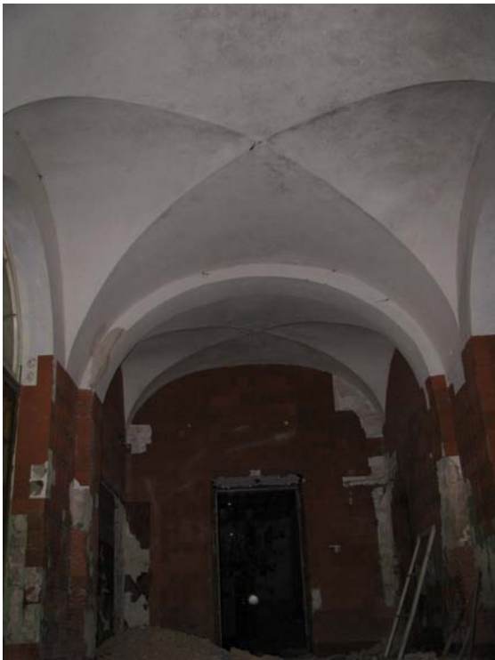
Vaizdas patalpoje 1-1