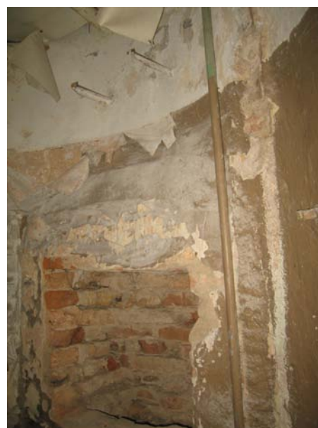
Niša patalpoje 2-3