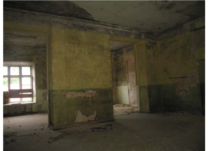
Vaizdas iš patalpos 2-6 į patalpą 2-7