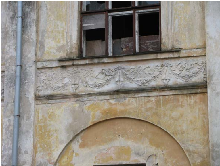
Dekoras po antro aukšto langu šiauriniame fasade