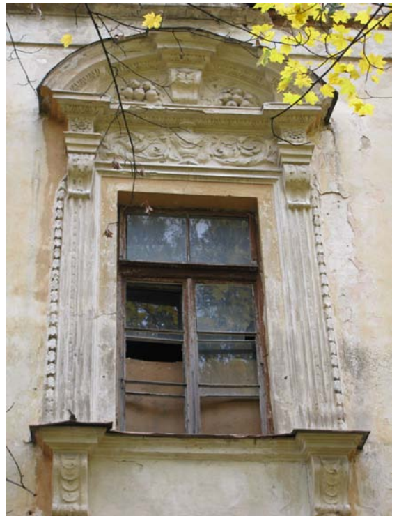
Antro a. lango dekoras virš įėjimo durų