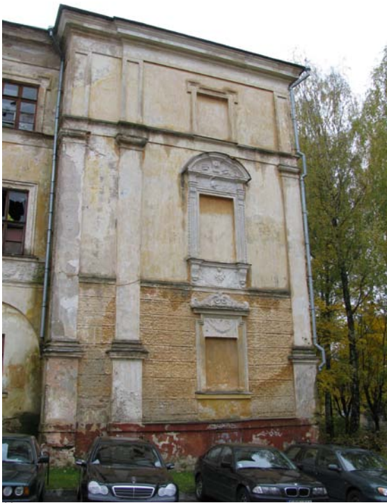
Šiaurinio fasado fragmentas - rizalitas