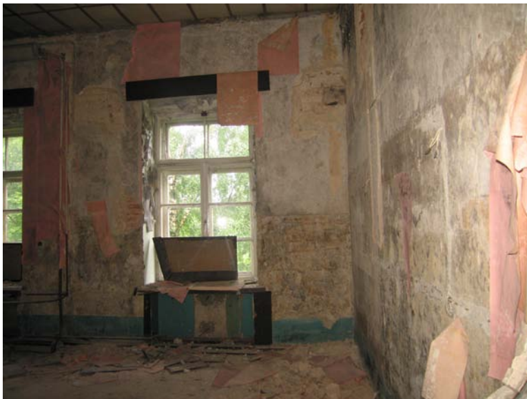
Patalpos 3-2 fragmentas