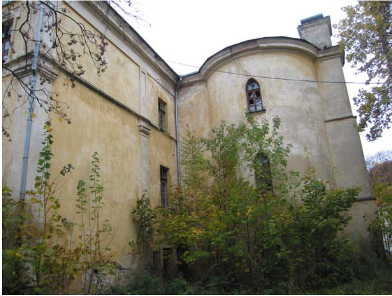
Rytinis bokštas ir jungtis su rūmais pietinėje dalyje