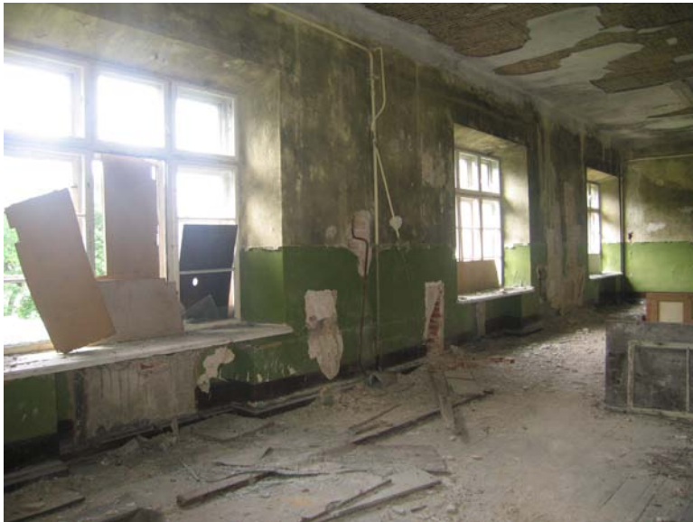
Vaizdas patalpoje 3-13