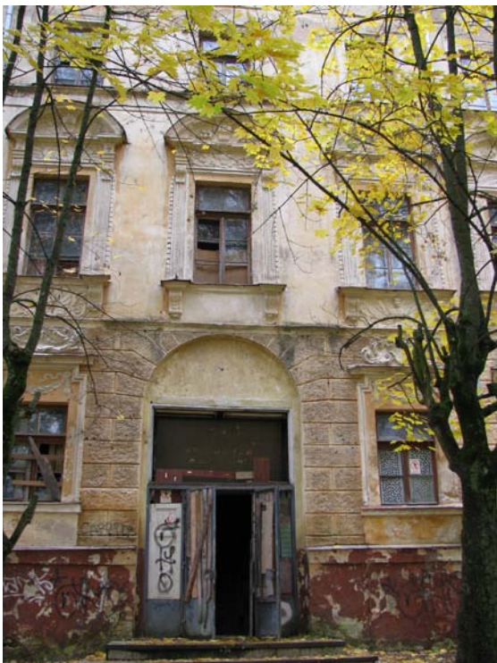
Vakarinio fasado fragmentas – pagrindinis įėjimas į rūmus