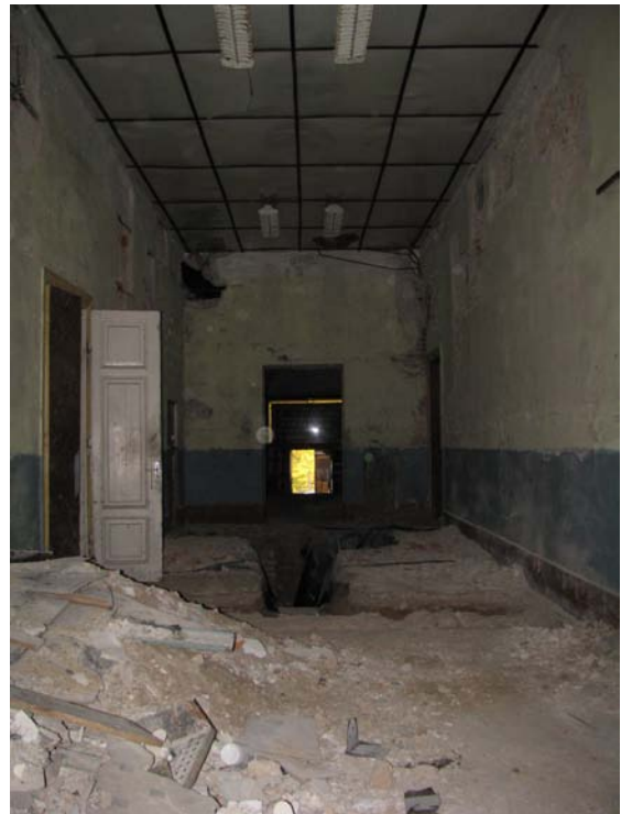
Vaizdas patalpoje 1-20