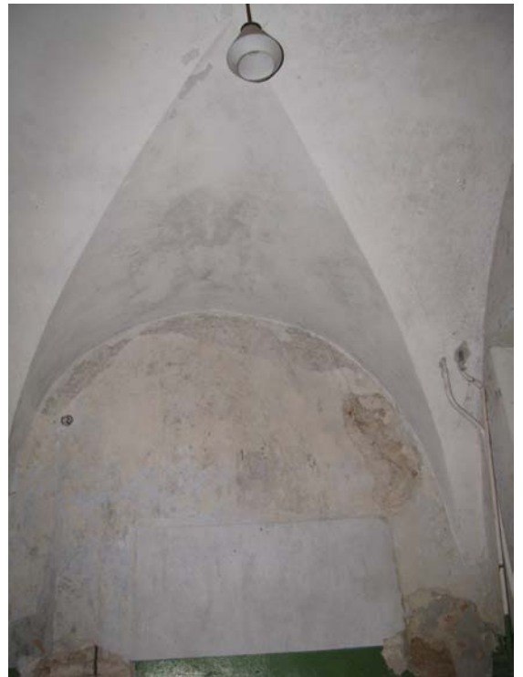
Skliauto patalpoje 1-11 fragmentas