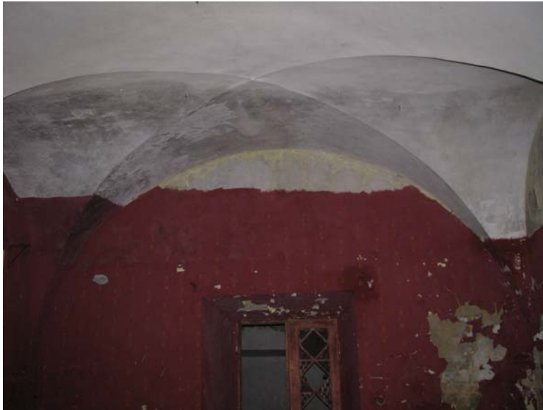
Vaizdas patalpoje 1-25