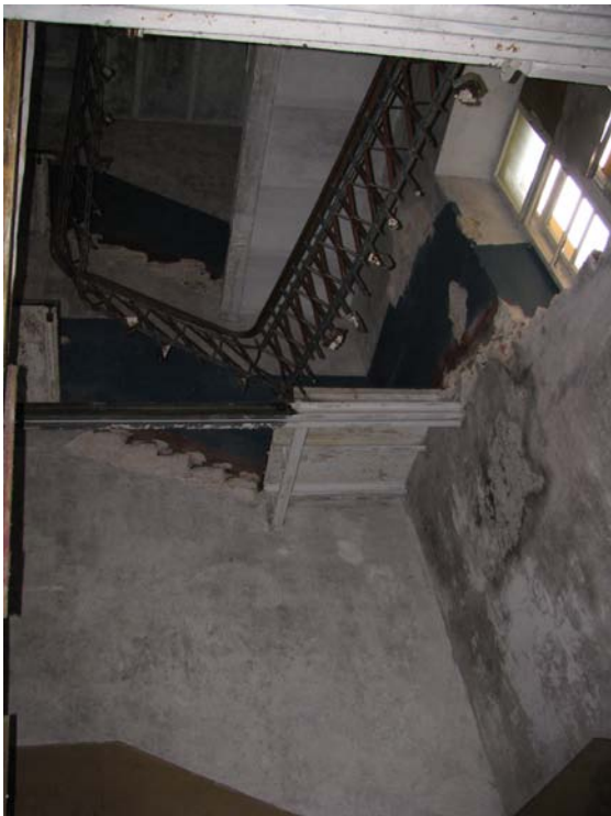
Vaizdas laiptinėje (1-23, 1-22, 2-9, 3-7)