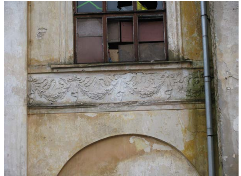
Dekoras po antro aukšto langu šiauriniame fasade