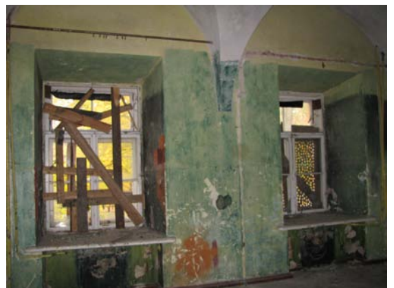
Patalpos 1-24 fragmentas