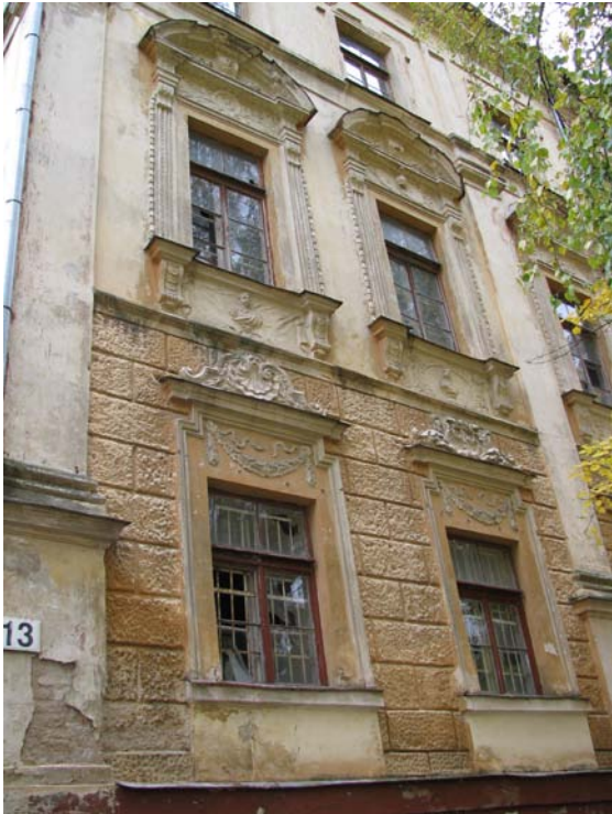
Vakarinio fasado fragmentas