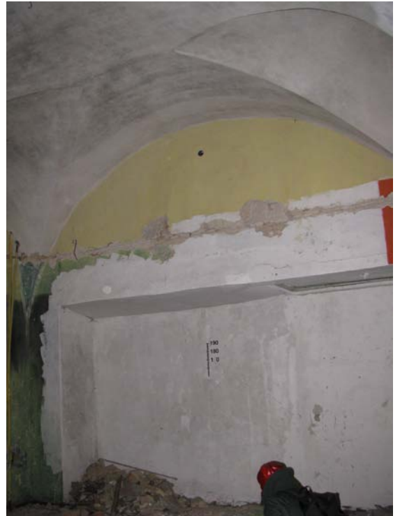
Niša patalpoje 1-24