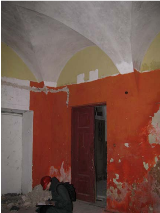
Vaizdas patalpoje 1-24