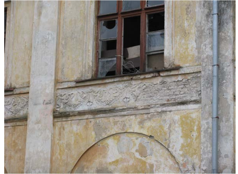
Dekoras po antro aukšto langu šiauriniame fasade