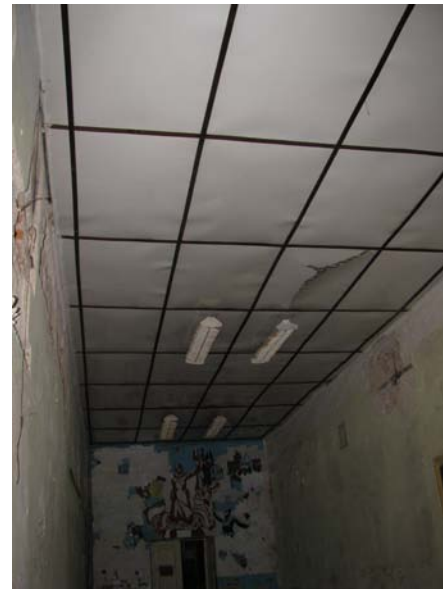
Vaizdas patalpoje 1-20