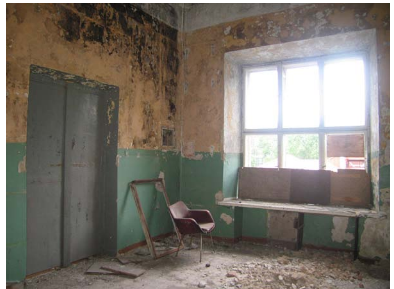
Vaizdas patalpoje 2-5