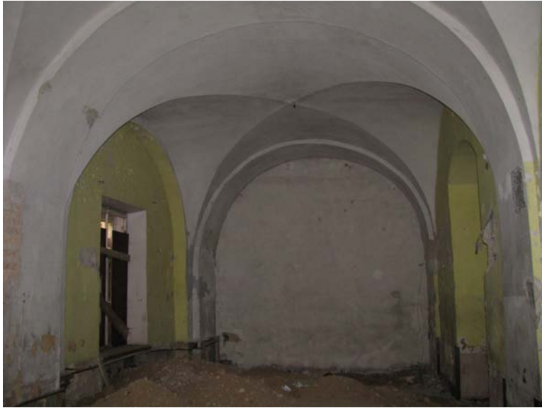
Vaizdas patalpoje 1-19