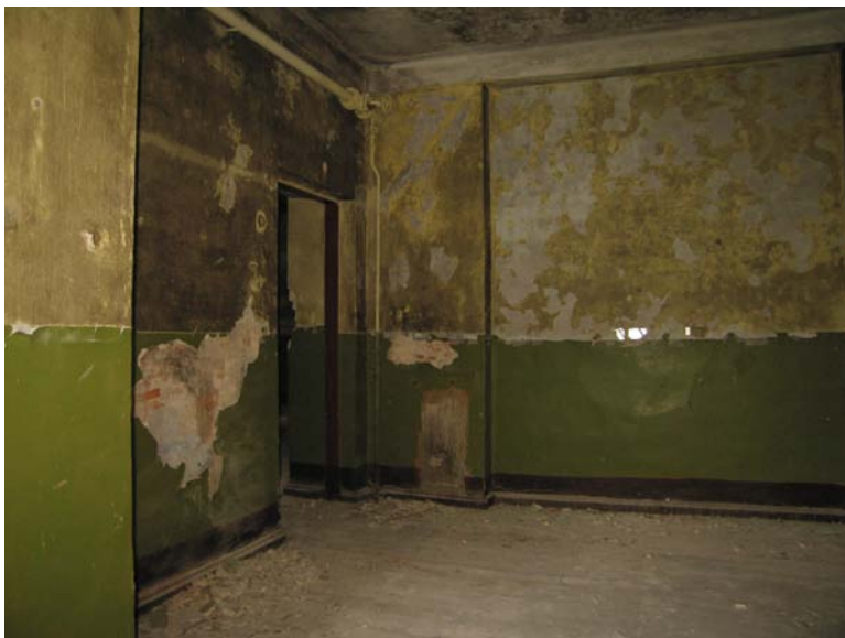
Vaizdas patalpoje 3-14