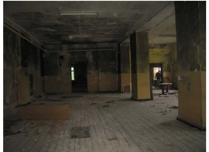
Vaizdas patalpoje 3-6