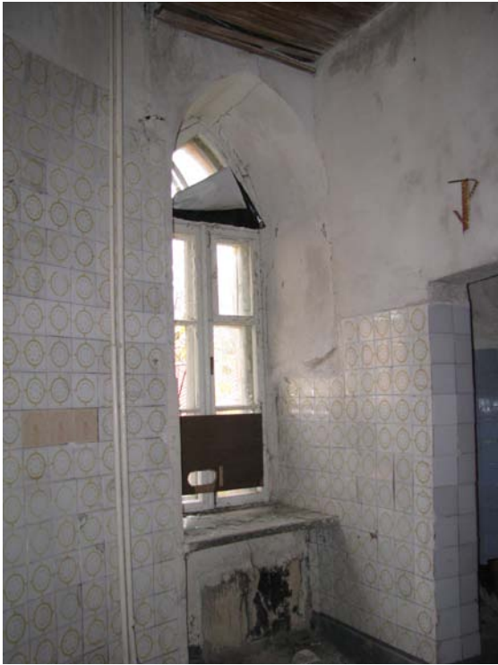
Vaizdas patalpoje 3-9