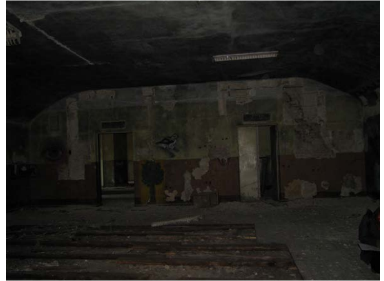
Vaizdas patalpoje 2-1