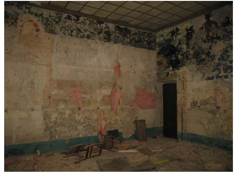
Patalpos 3-2 fragmentas