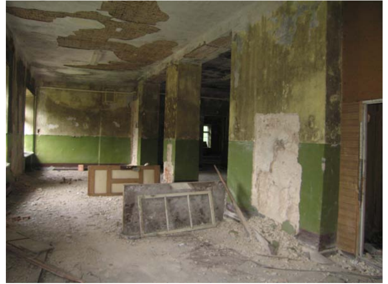
Vaizdas patalpoje 3-13