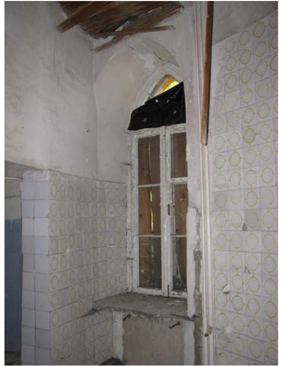
Vaizdas patalpoje 3-9