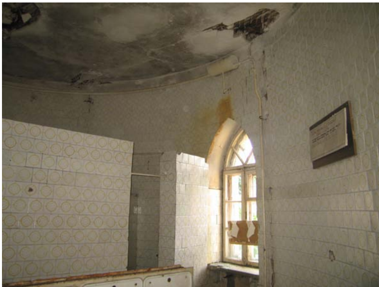
Vaizdas patalpoje 3-9