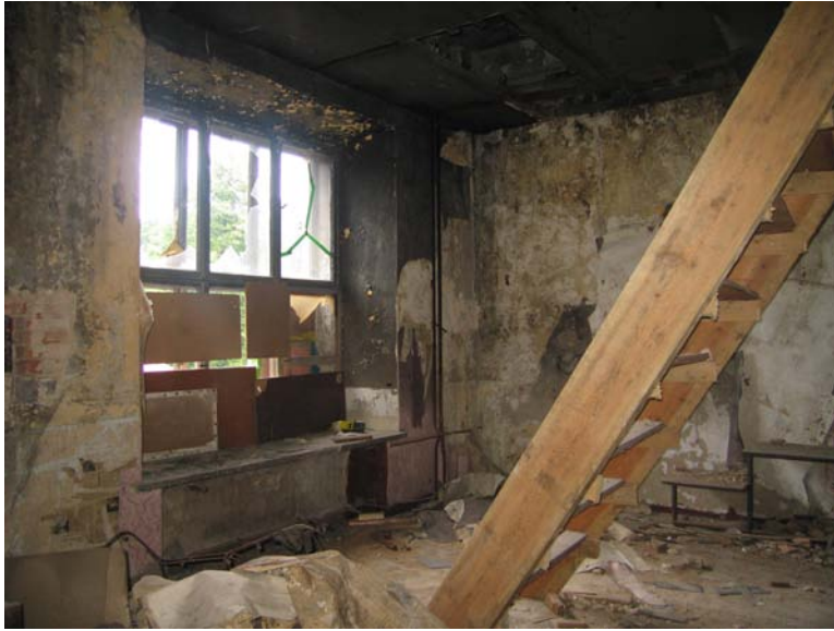
Vaizdas patalpoje 2-4