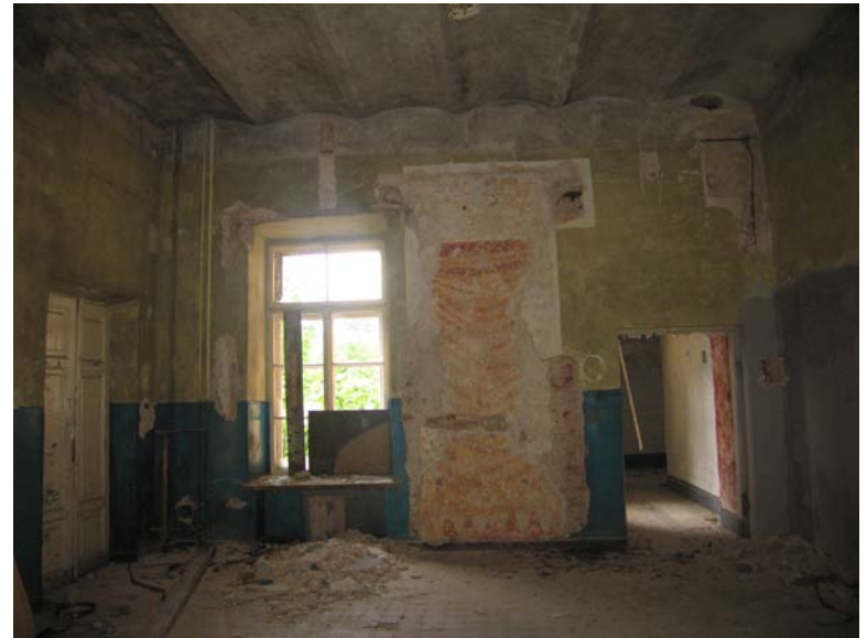
Vaizdas patalpoje 2-10