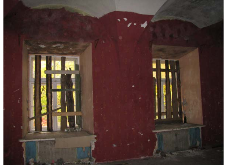
Vaizdas patalpoje 1-25