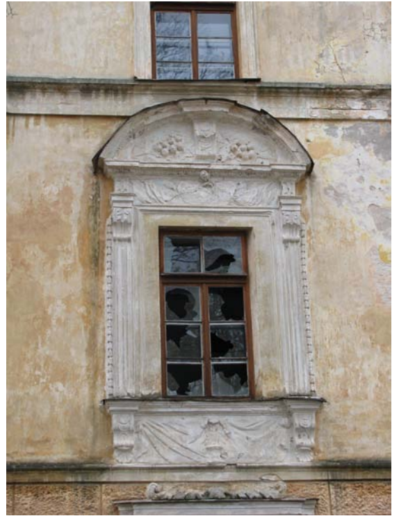
Rizalito antro a. dekoras