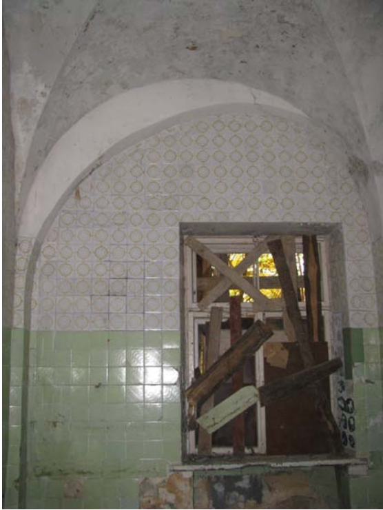
Vaizdas patalpoje 1-21