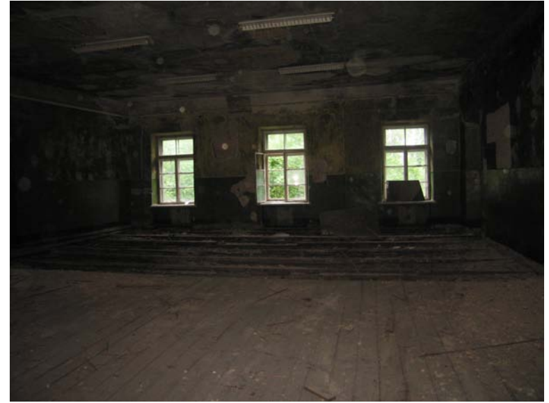
Vaizdas patalpoje 3-1