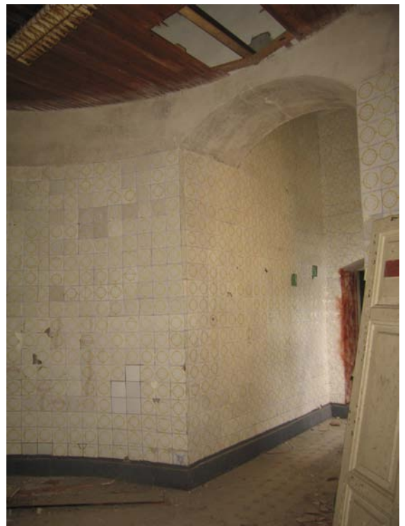
Vaizdas patalpoje 3-9