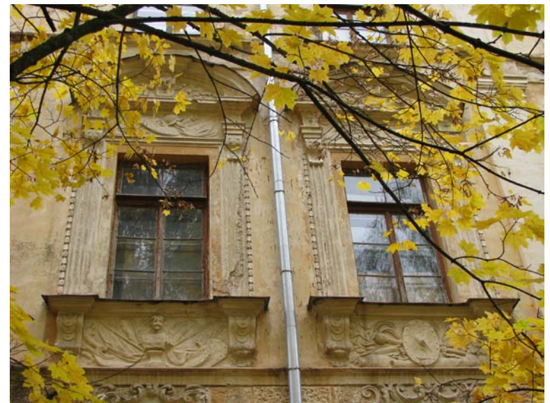
Vakarinio fasado antro a. langų dekoras