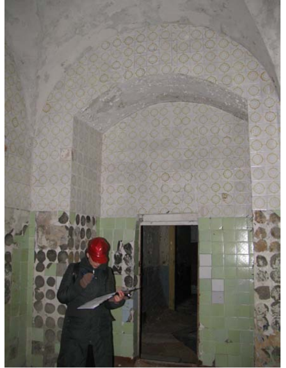
Vaizdas patalpoje 1-21