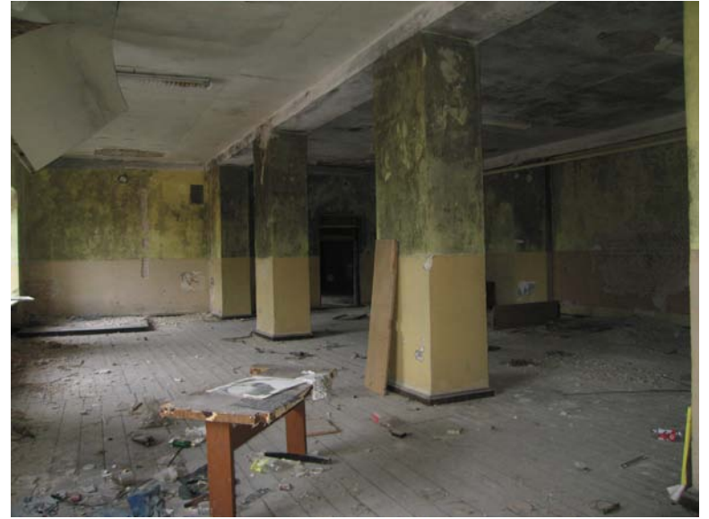
Vaizdas patalpoje 3-5