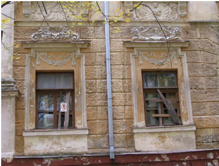
Vakarinio fasado pirmo a. langų dekoras