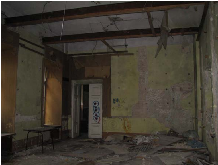
Vaizdas patalpoje 2-19