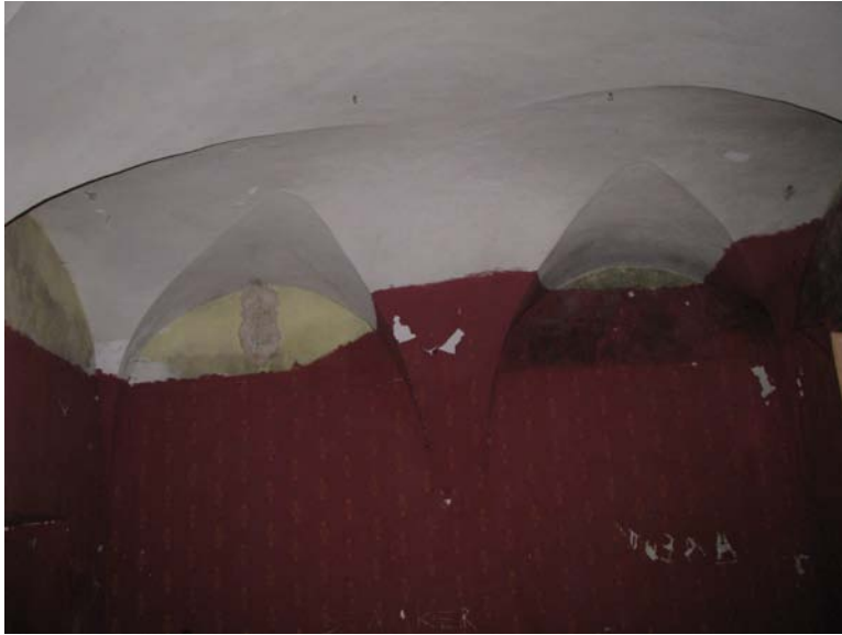
Vaizdas patalpoje 1-25