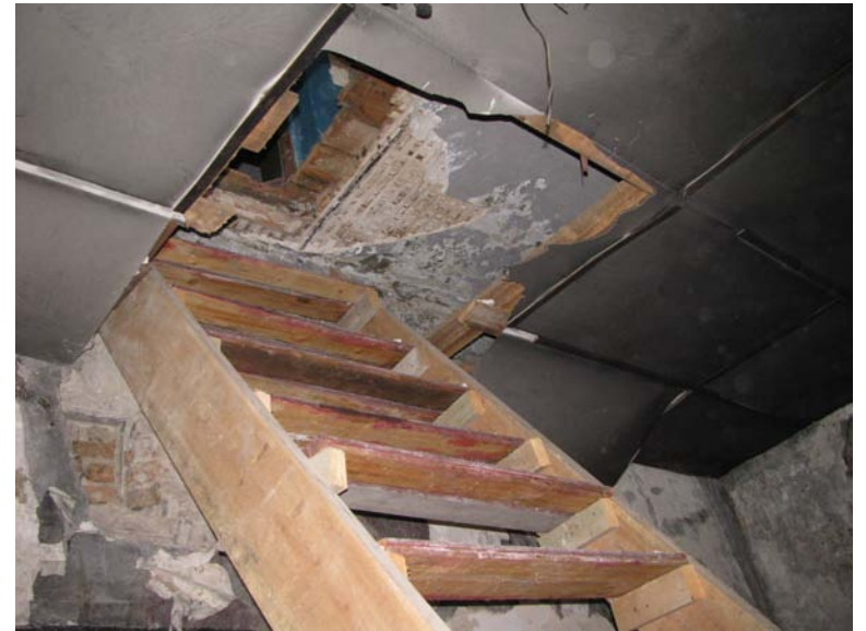
Patekimas iš antro a. patalpos 2-4 į trečią a.