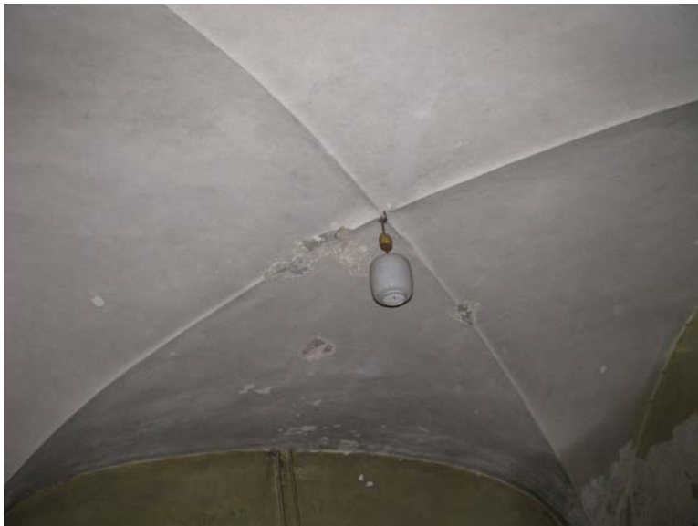
Skliauto fragmentas patalpoje 1-18