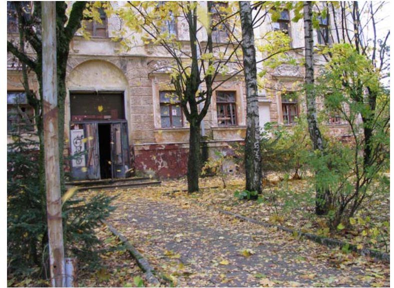
Vakarinio fasado fragmentas