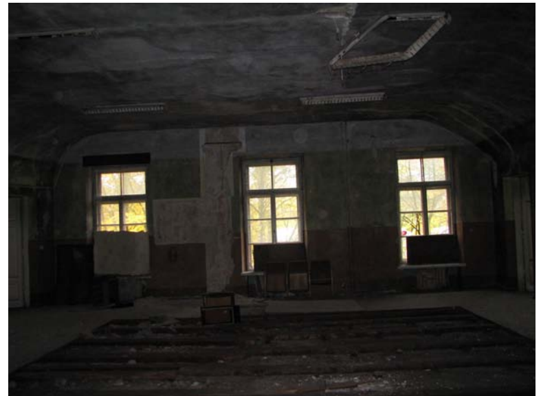
Vaizdas patalpoje 2-1