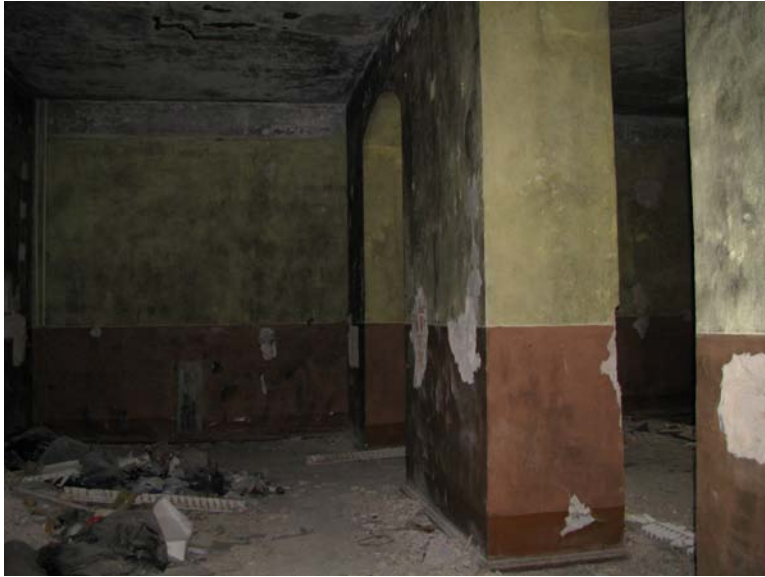
Patalpos 2-16 fragmentas