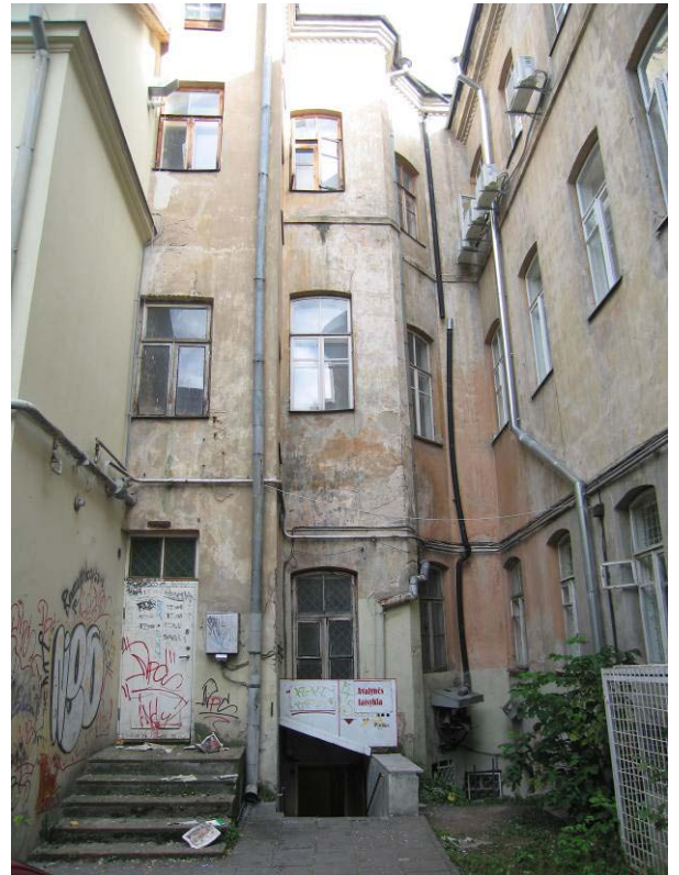
Kiemo fasadas ties apziūrētomis rūšio patalpomis