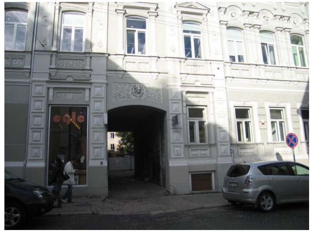
Pastato vaizdas nuo Vilniaus gatvės