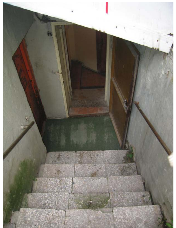
Laiptai ī rūšio patalpas