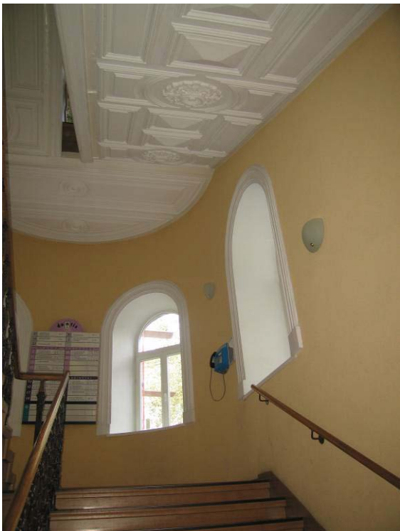
Vaizdas laiptinēje tarp I-mo ir II-ro aukštų