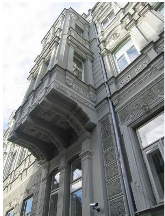
Pastato vaizdas nuo Vilniaus gatvės ties apžiūrėtomis patalpomis