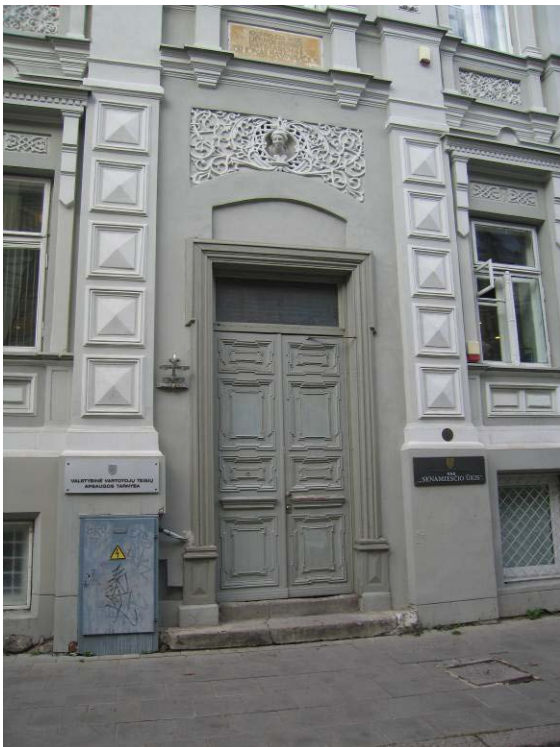
Pastato vaizdas nuo Vilniaus gatvės