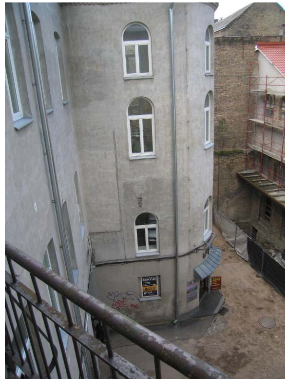
Vaizdas iš balkono, kiemo fasadas