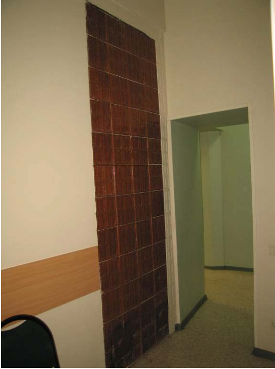
Vaizdas patalpoje Nr. 3-23, koklinė krosnis