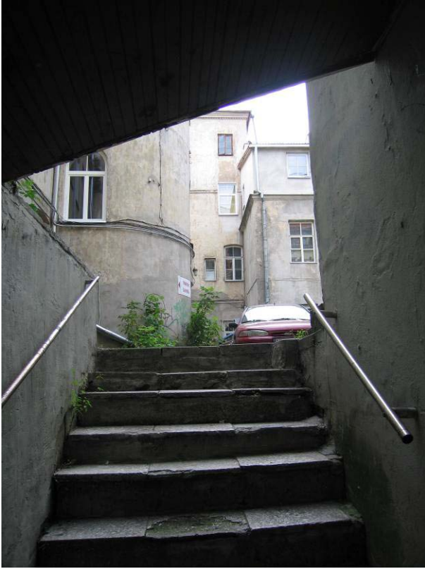
Laiptai iš rūšio į kiemą