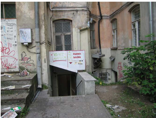
Kiemo fasadas ties apziūrētomis rūšio patalpomis