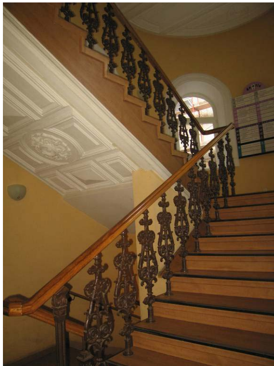
Laiptai į II-rą aukštą, laiptų dekoru fragmentas