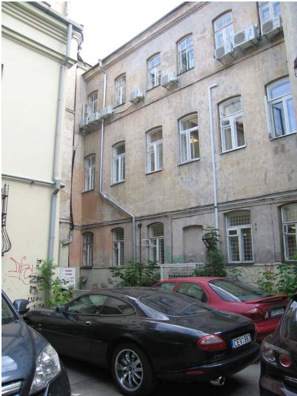
Kiemo fasadas ties apziūrētomis rūšio patalpomis