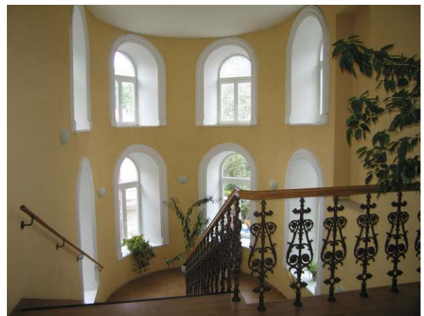
Vaizdas III-čio aukšto laiptinėje