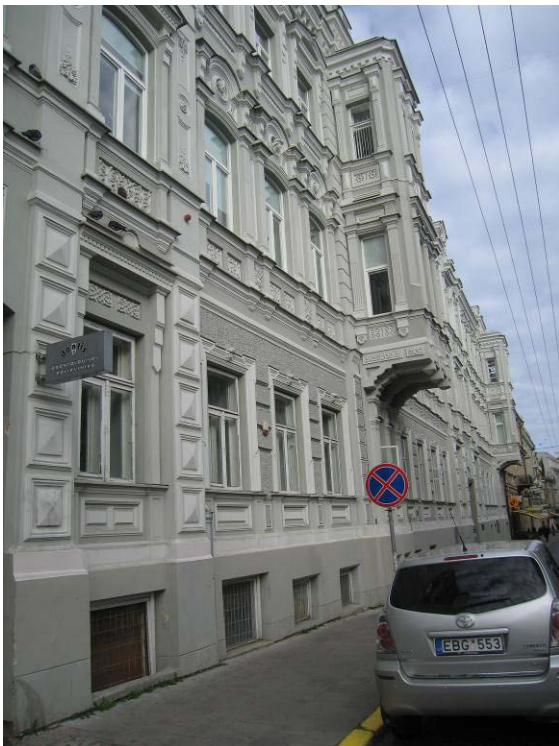
Pastato vaizdas nuo Vilniaus gatvės ties apžiūrėtomis patalpomis