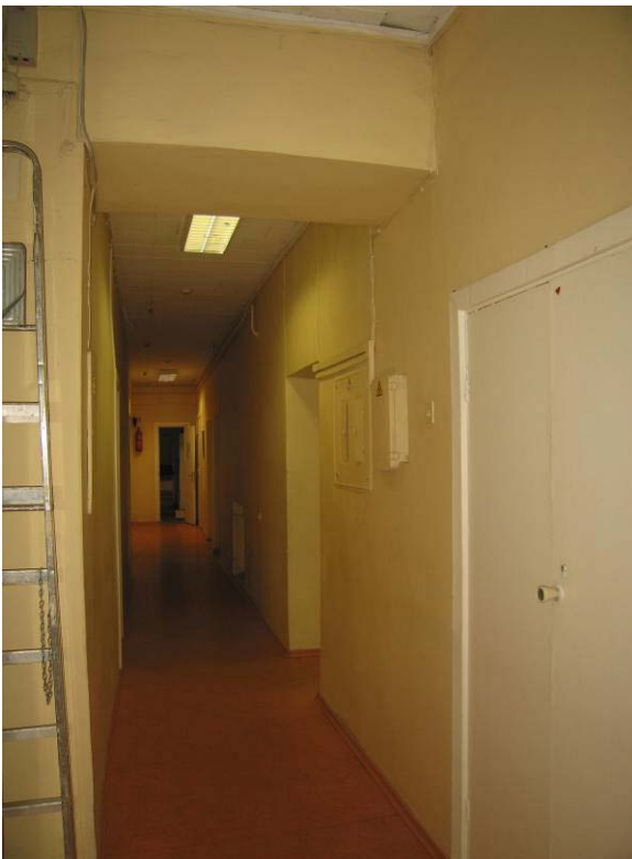
Vaizdas patalpoje Nr. 3-40