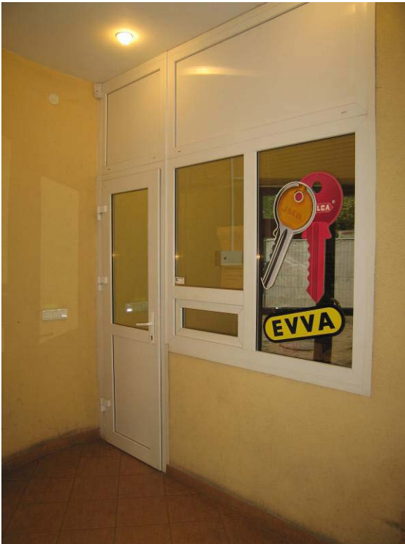
Vaizdas I-ame aukšte – laiptinėje