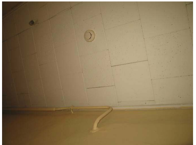
Pakabinamų lubų fragmentas patalpoje Nr. 3-40