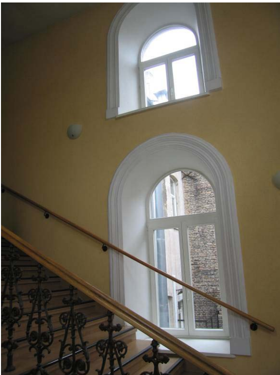
Vaizdas laiptinėje tarp II-ro ir III-čio aukštų