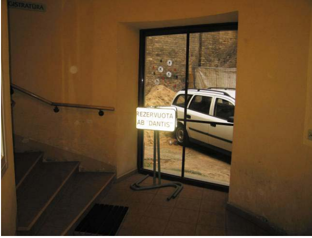
Vaizdas I-ame aukšte – laiptinėje