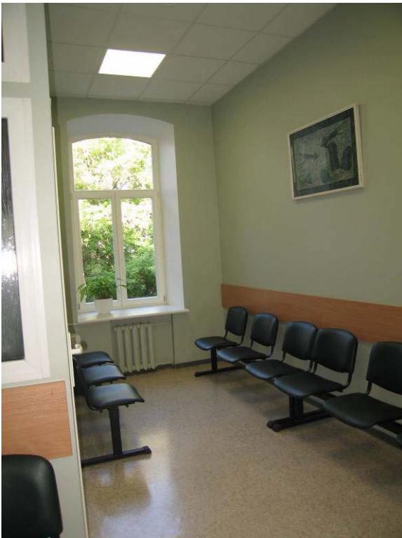
Vaizdas patalpoje Nr. 3-26