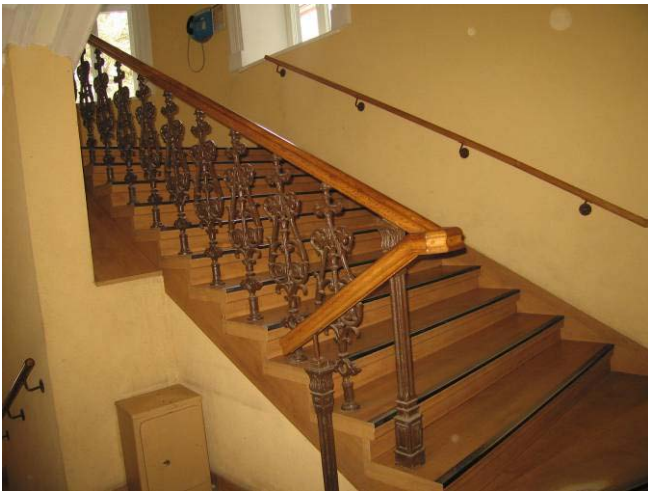
Laiptų į II-ra aukštą turėklų fragmentas