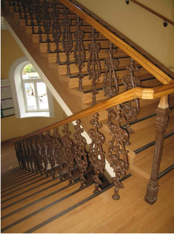
Laiptai į II-rą aukštą, laiptų turėklų turėklų dekoru fragmentas