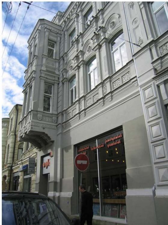
Pastato vaizdas nuo Vilniaus gatvės ties apžiūrėtomis patalpomis