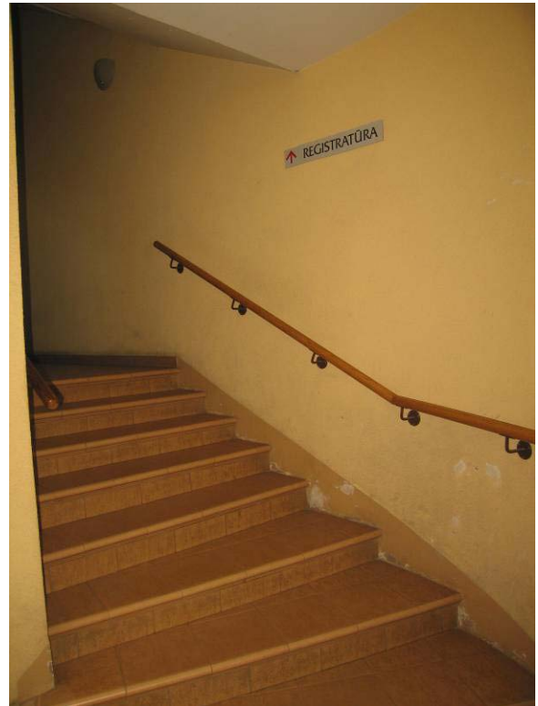
Laiptai iš I-mo aukšto link patalpos Nr. 3-1