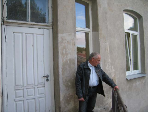
Vaizdas balkone ties apžiūrētomis patalpomis Nr. 3-44