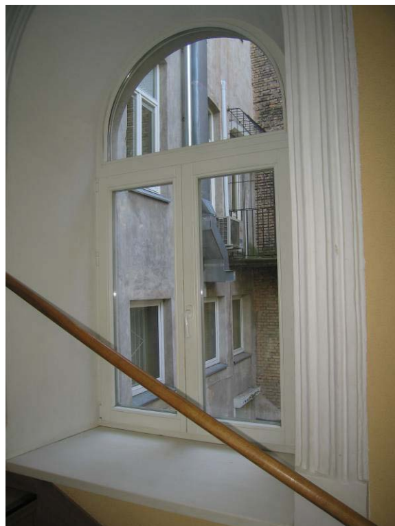
Langas laiptinēje tarp I-mo ir II-ro aukštų