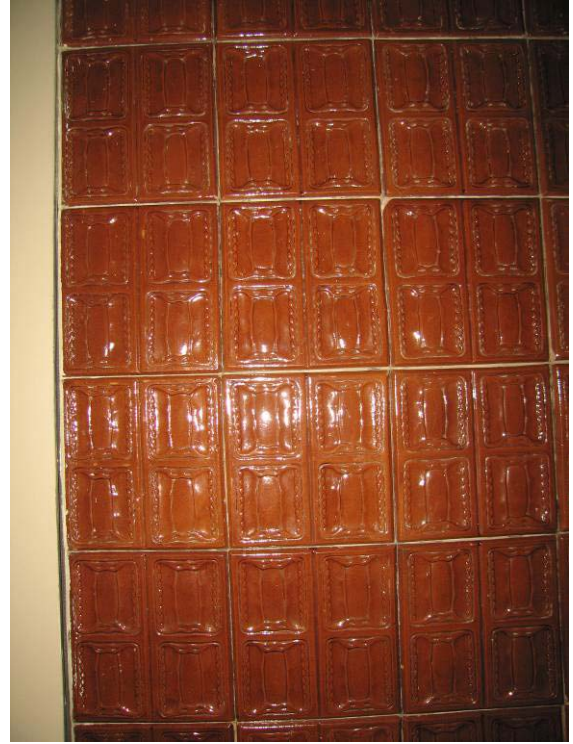
Patalpoje Nr. 3-23 esančios koklinės krosnies fragmentas