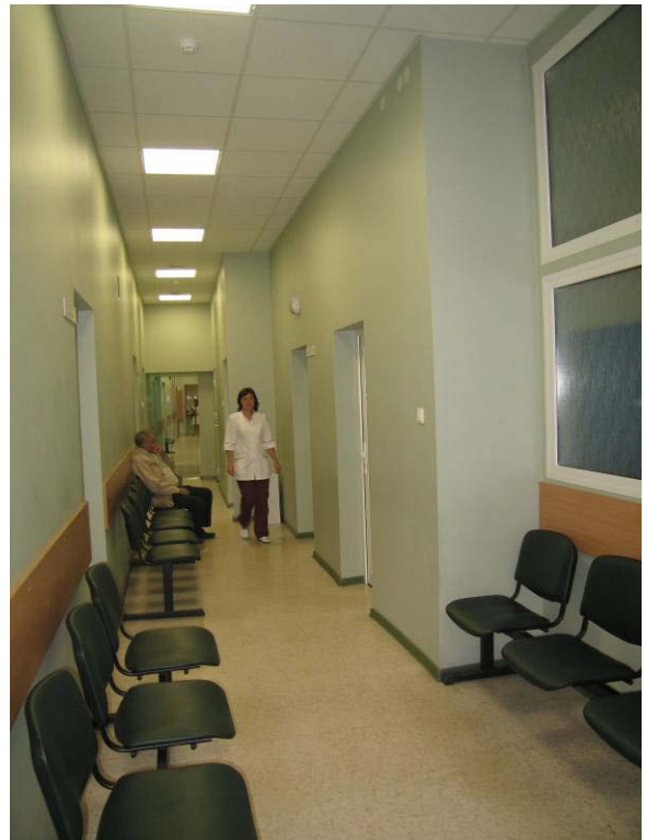
Vaizdas patalpoje Nr. 3-26