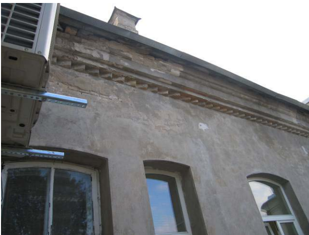
Vaizdas balkone ties apžiūrētomis patalpomis Nr. 3-44