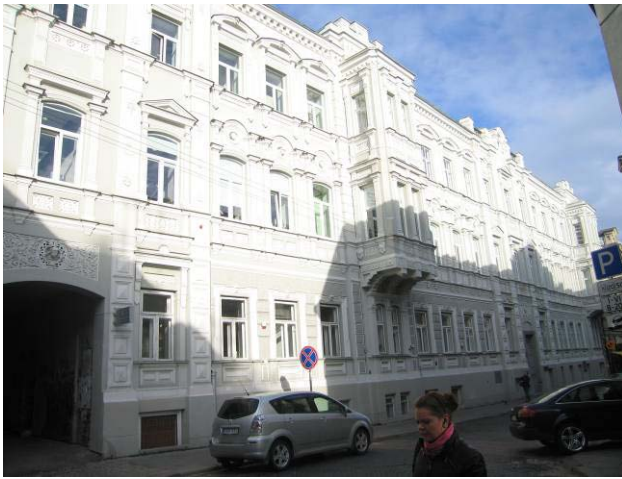
Pastato vaizdas nuo Vilniaus gatvės