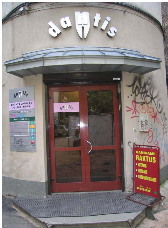
Iėjimo į patalpas durys kiemo fasade