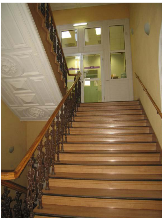
Laiptai į II-ra aukštą