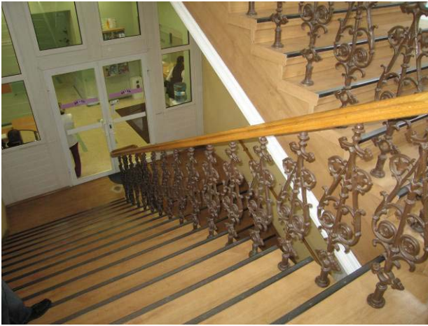
Laiptų fragmentas tarp II-ro ir III-čio aukštų