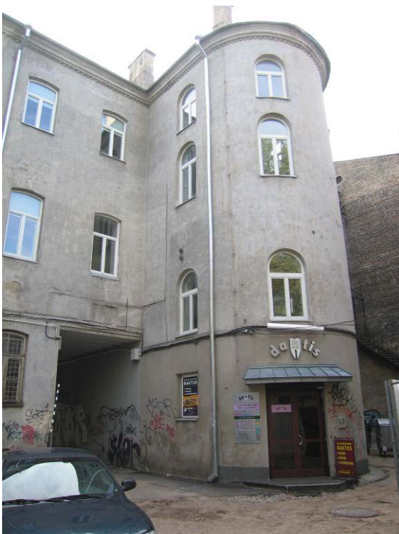
Iėjimo į patalpas durys kiemo fasade