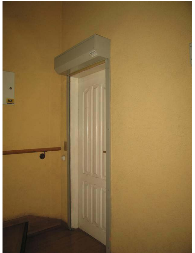
Durys į patalpą Nr. 3-1