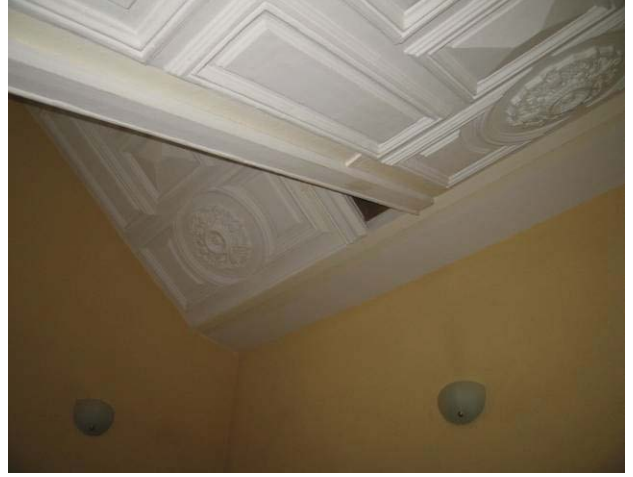
Laiptų dekoru fragmentas