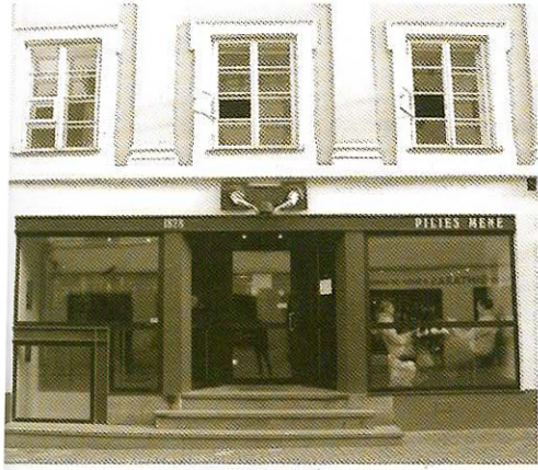
~ Pilies gatvės 8/1 namo fasado dalis, 2005 m.