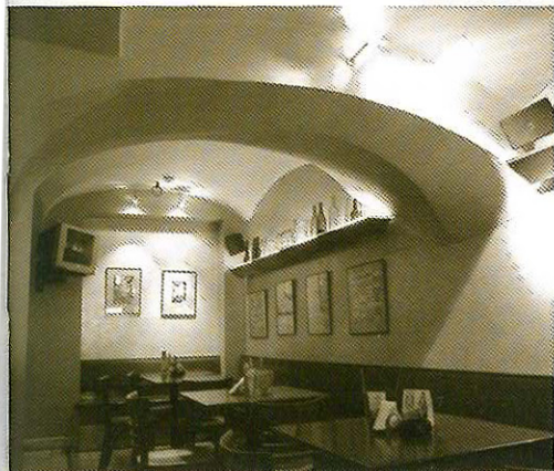
~ Pirmo aukšto ir rūsio skliautai, 2004 m.